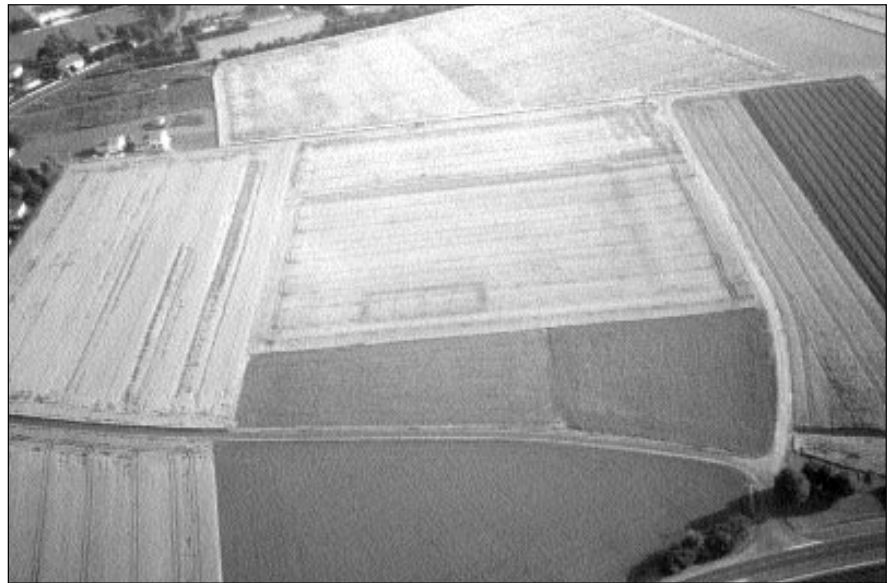
Fig. 1 : Chappes – Tarrat : photographie aérienne du site

Enfin, des sites ont été repérés sans qu'aucune chronologie ne puisse être donnée, faute d'artefact au sol. C'est le cas