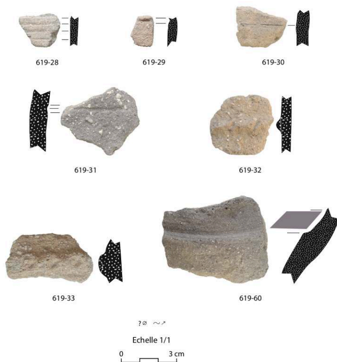
Fig. 3 – Les Neuf Fontaines, Saint-Georges-sur-Allier : vaisselle céramique