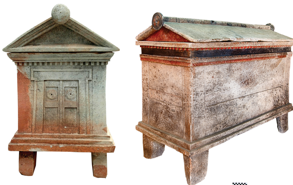
9. Sarcophages hellénistiques provenant de la région de Paphos.