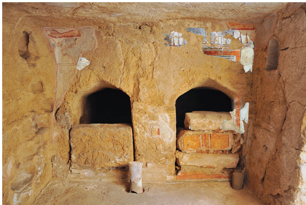
8. Tombe hellénistique de la place Kostis Palamas (Ktima-Paphos) : vestiges d'enduits peints. Essai de collage des parties manquantes. Photo et conception du montage E. Raptou ; réalisation Chr. Papadopoulos ; © E. Raptou.