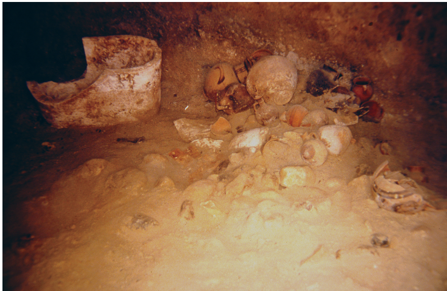
3. Palaepaphos. Baignoire et céramiques dans une tombe.