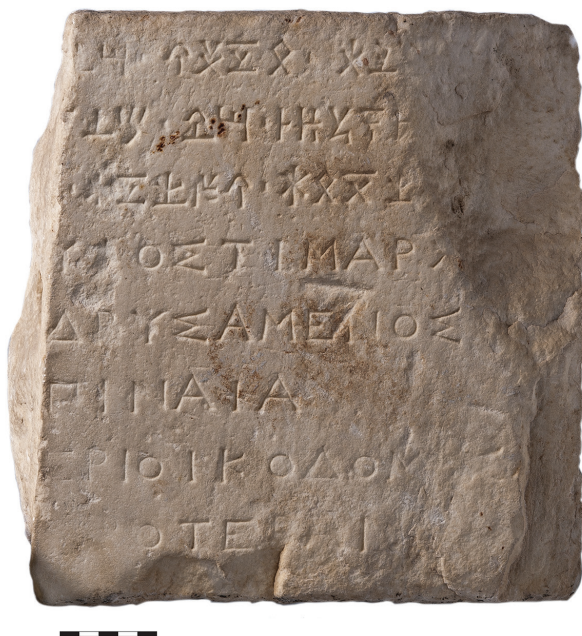
5. Inscription digraphe trouvée à Paphos (secteur de Maloutena ), musée de Paphos n° inv. PM 357.

au revers d'une monnaie frappée par Nikoklès 23 . D'autres inscriptions, telles celles découvertes sur la façade de l'église d' Agia Moni , près du village de Panaghia, une vingtaine de kilomètres au nord de Palaepaphos, témoignent d'actes d'évergétisme effectués par Nikoklès en l'honneur d'Héra 24 . De même, une inscription (fig. 5), trouvée sur le site de la future Nea Paphos, témoigne de la fondation ([i]δρυσάμενος) et de l'extension ([ἐ]πίναια) d'un sanctuaire d'Artémis Agrotera, avec construction d'un mur ([π]εριοικοδομήσ[ας]), par Nikoklès lui-même semble-t-il (le dédicant est dit υἱὸς Τιμάρχ[ου]) 25 : « Il s'agit, de fait, du seul document provenant du site de ( Nea ) Paphos que l'on puisse attribuer à Nikoklès avec une forte probabilité, le nom de ce roi étant restitué avec un risque d'erreur limité, sachant que le nom de son père, Timarchos, est connu par d'autres inscriptions 26 ».