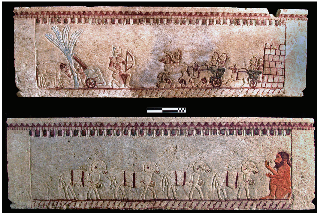
4. Faces principales de la cuve du sarcophage découvert dans une tombe à Palaepaphos (Kouklia).

sanglier – peut indiquer des influences venant d’Occident comme d’Orient ; en revanche, on reconnaît aisément, dans la deuxième scène, une référence grecque au poème épique L’Éthiopide décrivant Ajax portant la dépouille d’Achille 14 . Une autre référence à la littérature grecque épique se reconnaît sur l’un des grands côtés du sarcophage : Ulysse et ses compagnons, attachés au ventre de quatre bœufs fuyant la grotte de Polyphème représenté ici à droite ; ce thème, très populaire dans le monde grec d’époque classique, a été décliné sur des vases en bronze comme sur des céramiques 15 . La scène guerrière qui décore l’autre grand côté de la cuve appelle plus de commentaires : on y reconnaît aisément Héraclès, la tête recouverte par sa peau de lion, à gauche, tandis qu’un bige, dételé, est appuyé à un palmier derrière lequel paraît se cacher un personnage, les deux chevaux se tenant à gauche. Le héros grec est tourné vers la droite, un genou à terre et l’arc bandé, tandis que,