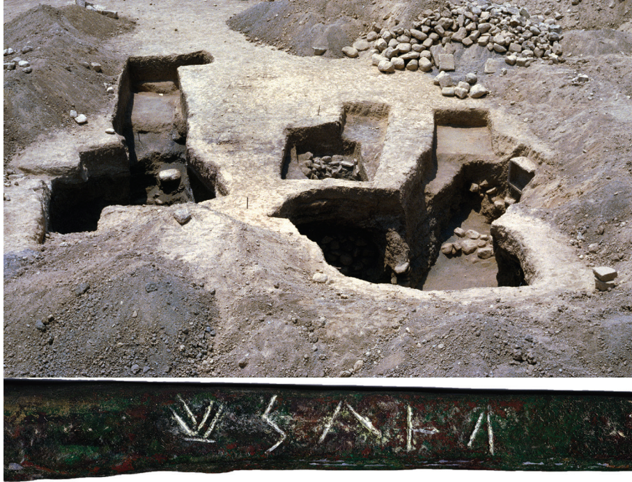
2. Tombe à dromos de Palaepaphos ayant fourni l'obelos avec la première inscription grecque en chyro-syllabique.