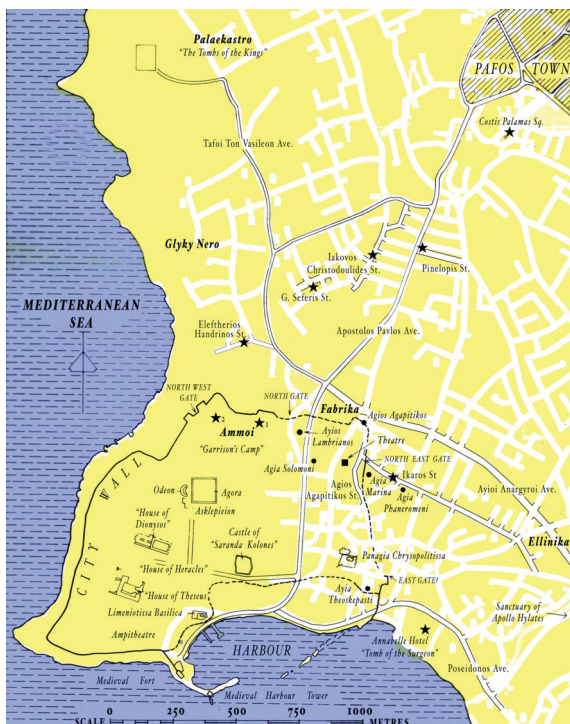
6. Emplacement du site de Nea Pafos et des principales zones de fouilles et nécropoles, d'après Raptou 2016, conception Cr. Barker.

de commencer par leur ériger un théâtre, lieu de culture hellénique s'il en est. Cependant, il est plus probable que ce théâtre ait été érigé après la reprise de Chypre aux Diadoques par Ptolémée en 294, en même temps que semble avoir été planifiée l'implantation urbaine de la nouvelle Pafos. Il paraît vraisemblable, en effet, que la petite agglomération qui s'était développée spontanément autour du port à la fin du IV e siècle, peut-être renforcée par la présence d'une garnison ptolémaïque, soit alors devenue une ville à part entière sous les premiers Ptolémées, au début du III e siècle, avant qu'elle ne devienne le siège du strategos , puis de la flotte lagide, au II e siècle av. J.-C.