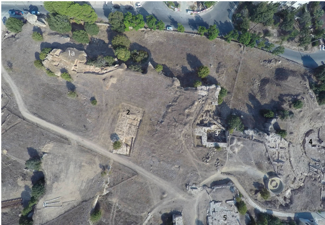
7. Vue par drone de la colline de Fabrika .  1a et 1b. rempart est. 2. aqueduc. 3. citerne. 4. théâtre. 5. temple.

Ainsi, au nord du port, la mission de la Jagiellonian University (Cracovie), a pu préciser que l'agora dite romaine existait déjà à l'époque hellénistique et que le lieu a été occupé dès le III e s. av. J.-C. 74 . Au lieu-dit Toumballos 75 , à mi-distance entre l'agora et la colline de Fabrika , l'ensemble cultuel, identifié par la mission de l'université de Catane comme un sanctuaire à Apollon et Artémis, reste à dater précisément. Sur cette colline (fig. 7), la MafaP a mis au jour, sur ca 10 m, un important tunnel rupestre qui débouche dans une grande citerne. La fouille a montré que celle-ci avait cessé d'être utilisée au II e s. apr. J.-C., mais il n'a pas encore été possible de dater le creusement de l'aqueduc rupestre, dont une prospection géophysique, conduite par Ch. Bénech (CNRS), a permis de préciser le prolongement du tracé jusqu'au pied du versant nord de la colline 76 . Enfin, le