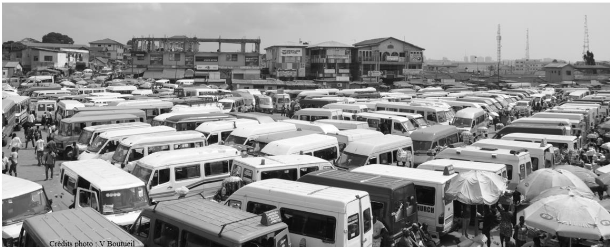
Figure 1 – Concentration de tro-tros au marché Kaneshie, à Accra