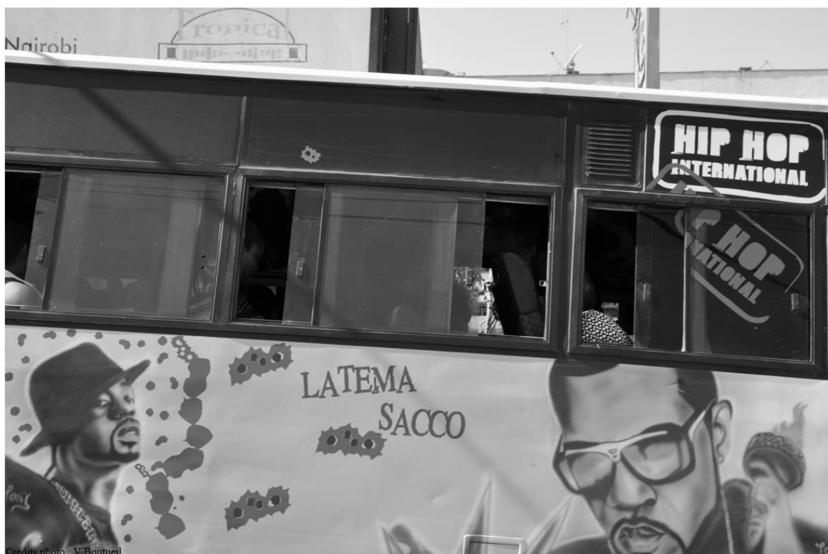
Figure 2 – Matatu peint pour une clientèle souhaitant voyager « avec style », à Nairobi

D'autres qualités, corollaires à ces deux premières, sont également fréquemment attribuées aux modes intermédiaires de transport dans les villes africaines. Étroitement associée à la flexibilité de ces modes, leur capacité à innover est fréquemment soulignée : capacité à détourner de leur usage privatif certains types de véhicules à des fins de transport commercial (Diaz Olvera et al. , 2012) ; capacité à tuner certains véhicules pour différencier le service (équipement sonore, choix de répertoire musical, livrée haute en couleurs) (FERENCE, 2019) (Figure 2) ; capacité à mutualiser transport de passagers et transport de biens, en particulier sur les lignes desservant des zones de marché (Tichagwa, 2016). Au-delà de leur aptitude à créer des emplois, la disposition de ces modes à générer des ressources fiscales, notamment locales, est mise en avant (Lombard et Zouhoula Bi, 2008 ; Kamuhanda et Schmidt, 2009 ; Godard, 2013). Ces ressources sont au cœur d'enjeux de gouvernance importants. Leur affectation peut conditionner la survie des autorités organisatrices des transports et faire l'objet de luttes entre entités de supervision et de régulation (Godard, 2011 ; Godard, 2013 ; Cissokho, 2015 ; Zouhoula Bi, 2017).