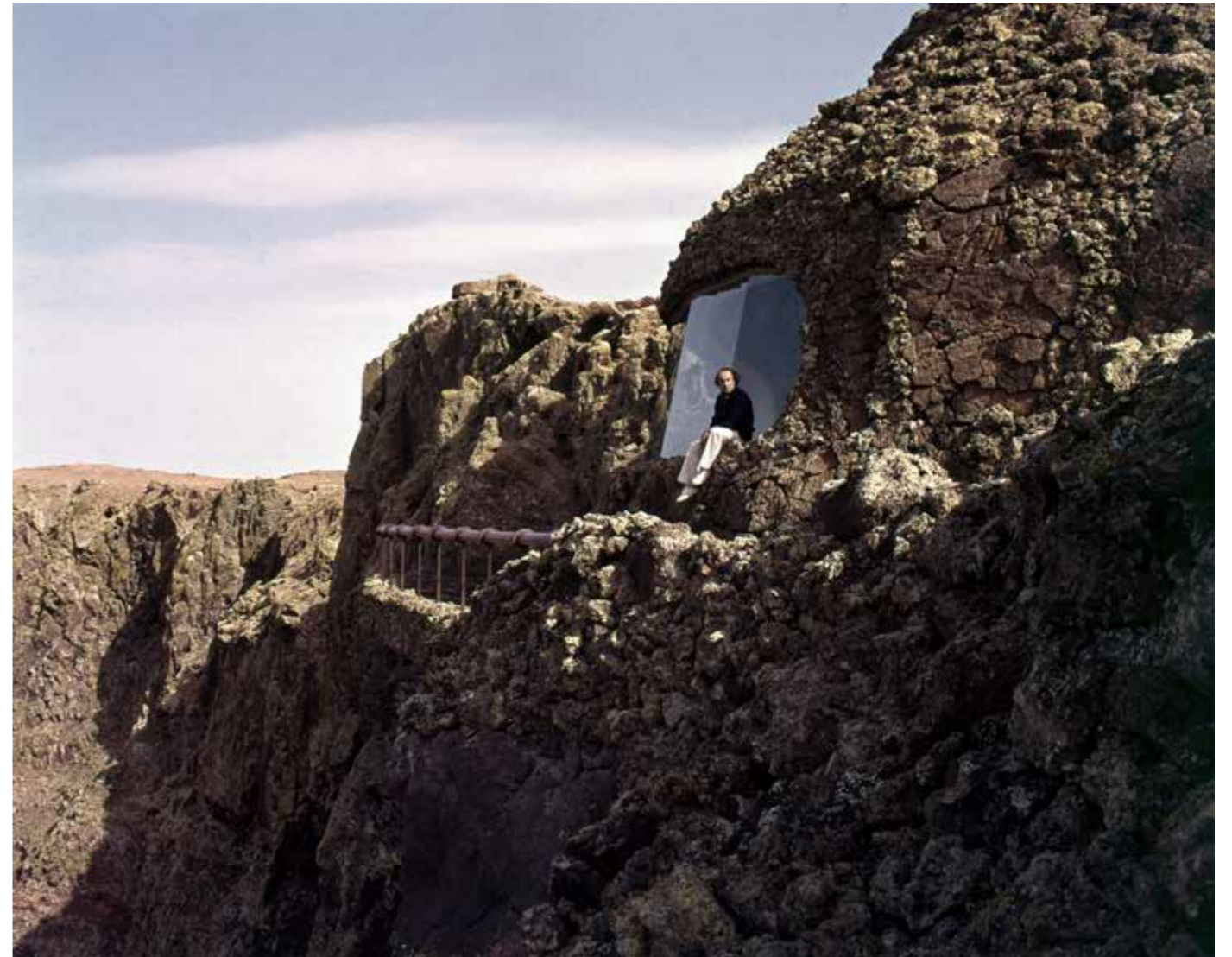
César Manrique au Mirador del Río.