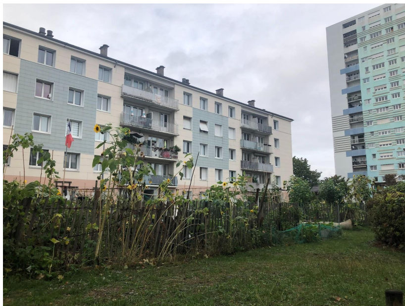
Illustration 1 – Le jardin partagé de la Cité Fabien de Bonneuil

Nous avons étudié ce jardin parce qu'il était présenté comme une initiative habitante : il s'agit d'une idée proposée par le Conseil citoyen et pas d'une initiative du bailleur. Autre point d'intérêt : les habitants ont aussi un rôle moteur dans sa gestion au quotidien puisque deux locataires sont référents du jardin et celui-ci est dépeint comme autogéré par les habitants. Et puis, enfin, parce que c'est aussi un jardin qui a la particularité d'être désigné comme un succès, notamment parce qu'il ne fait pas l'objet de dégradations. Mais aussi parce qu'au bout de deux ans, il y avait toujours un collectif d'une trentaine de jardiniers investis et parce que c'est un jardin qui n'est pas fermé à clef. Il est au contraire accessible par tous les habitants, ce qui explique peut-être d'ailleurs sa pérennité.