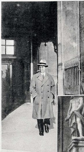
La cigarette au bec, l'œil soudain en arrêt, Emil Jannings a flairé le reporter.

DEPUIS quelques jours, des notes insérées dans différents journaux laissaient entendre que Emil Jannings avait formé le projet de se rendre en Europe. Mais ce n'était là qu'un bruit, une présomption et l'on pensait bien que lorsque le célèbre acteur s'embarquerait cent télégrammes nous en informeraient.