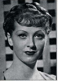
1936 Dans le Désainé vert , elle est la seule vedette féminine. La superation française de ce film est signée Jean D'Arcy.