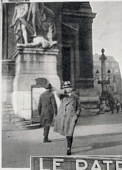
« Clic ! » l'objectif opère au centième de seconde, mais c'est raté quand même !

Et Emil Jannings, enfonçant son feutre, détaille comme un lièvre à travers la place de la Concorde !