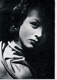
1937 La petite fille de Red à figurem . L'histoire d' Arabe de confiance a droit aux photographes sophistiqués et au départ.