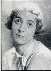
1931 Darrieux, née en 1917, à Paris, fille d'un opérateur et d'une chanteuse, débute au cinéma à la une dans le film métré Le Bal .