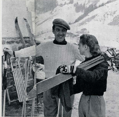
EN 1935, ELLE RENCONTRE HENRI BÉCON. L'ÉPOUSE C'EST LE TOURNANT DE LEUR CARRIÈRE A TOUS LES DEUX IL DEVIENDRA METTEUR EN SCÈNE. ELLE DEVIENDRA UNE VEDÈTE INTERNATIONALE.