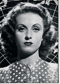
1938 L'ambition est maintenant terminée. Danielle Darrieux est devenue une star, mais qui passe au lambeau de Hollywood.