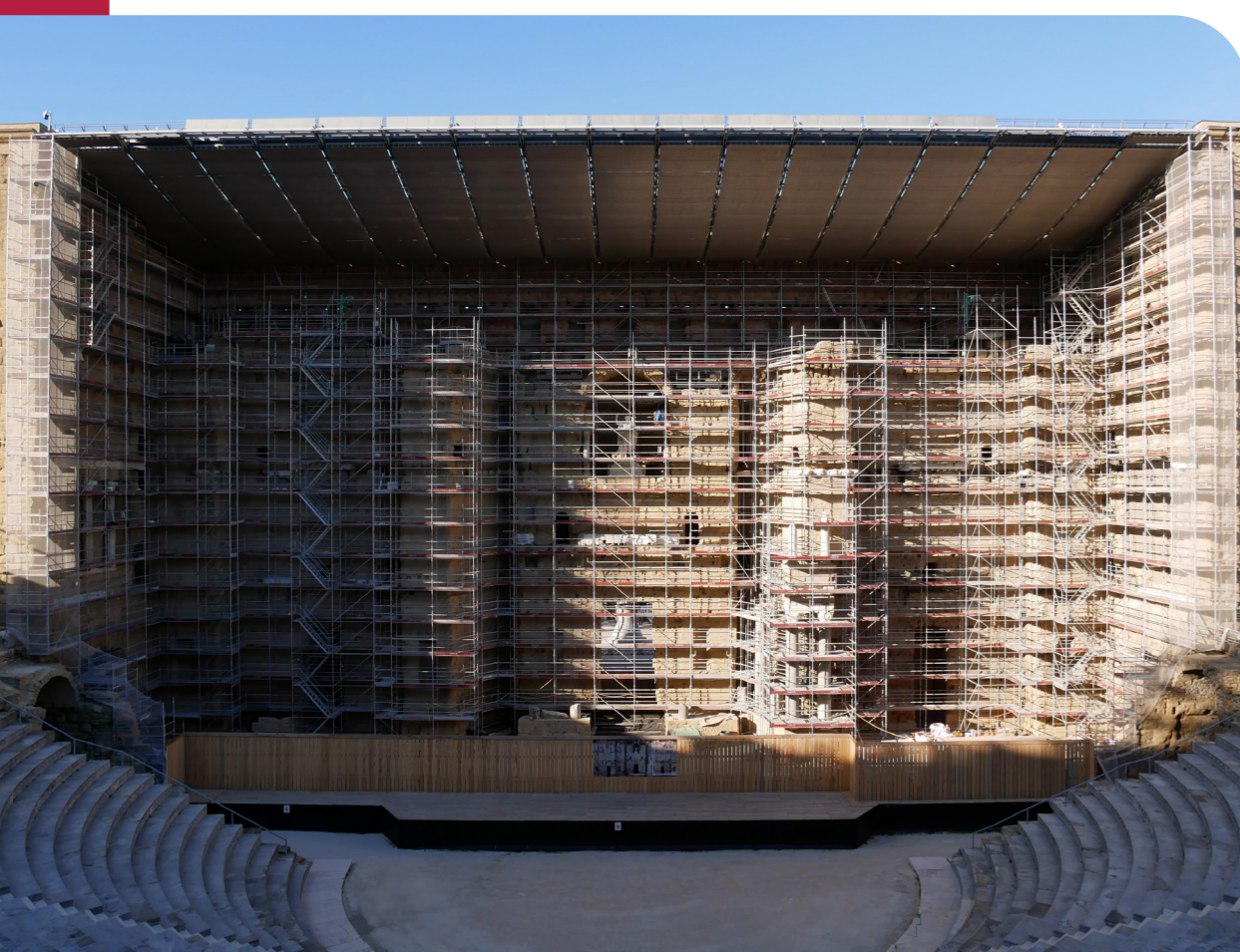
Le front de scène du théâtre échafaudé.

« Partenariat avec le monde socio-économique et culturel ».