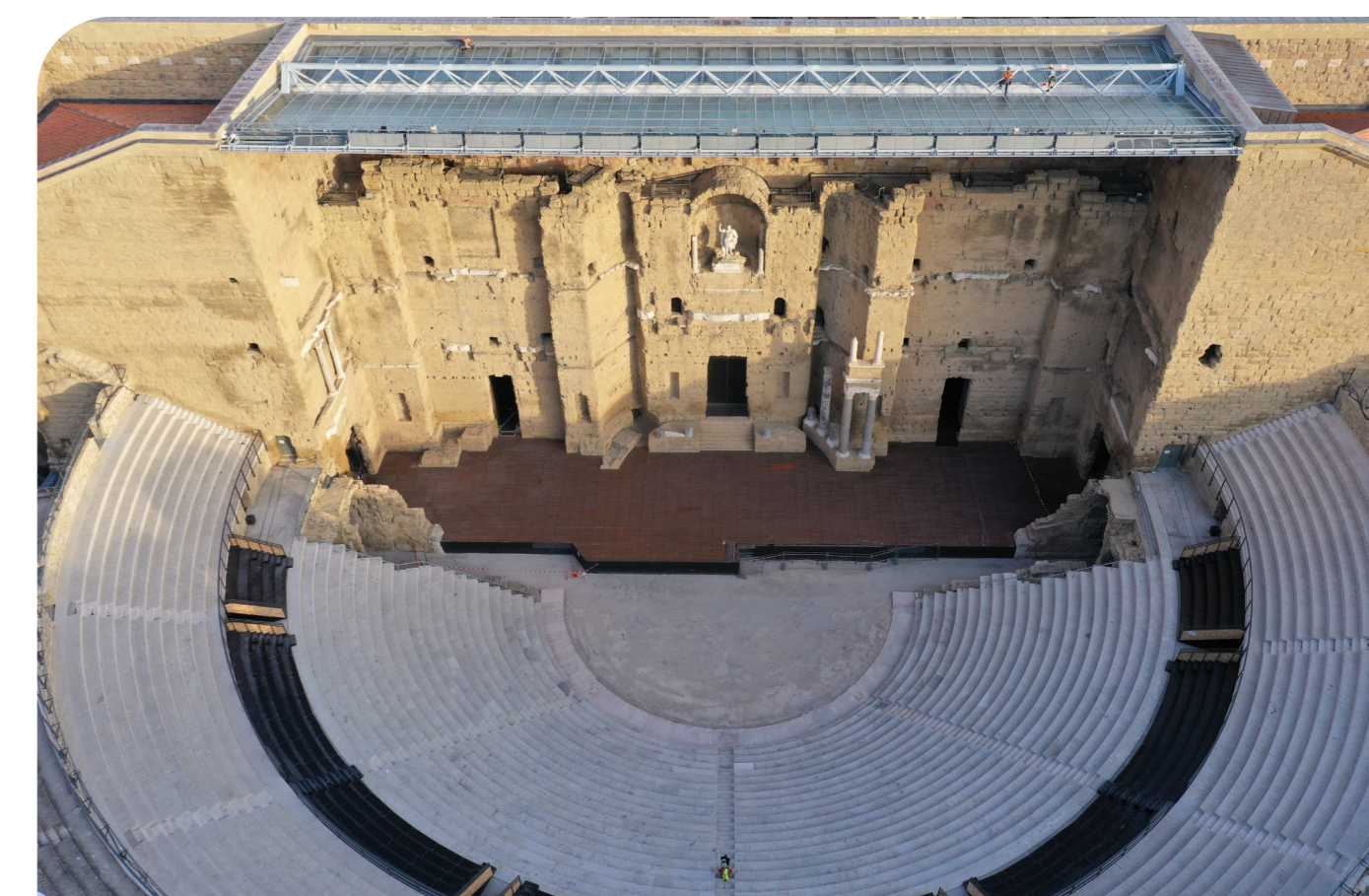
Vue aérienne du théâtre.

L'objectif est de développer une démarche interdisciplinaire de partage avec les acteurs scientifiques, patrimoniaux, économiques et culturels qui œuvrent pour l'étude, la conservation ou l'exploitation culturelle et touristique du monument. À cette fin, le projet TAIC2 s'appuie sur les acquis des Systèmes d'Information géographiques (SIG) pour les associer au potentiel du HBIM (Heritage Building Information Modeling).