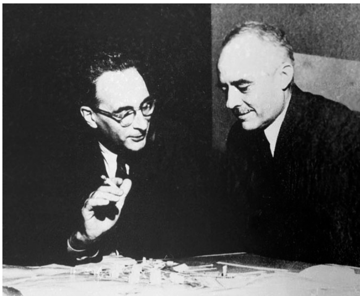
Fig. 1. Claude Levi-Strauss (à gauche) et Henri Seyrig (à droite) vers 1945.

Ceci étant dit, la présente contribution n'a vocation ni à critiquer les formes prises par ce soft power ni les institutions qui en sont porteuses, au premier rang desquelles, pour notre propos, le MEAE. Deux ouvrages sortis récemment des presses s'en chargent amplement 8 . Le premier, écrit par une journaliste, est un brûlot exclusivement à charge tandis que le second, qui dresse un état des lieux critique mais néanmoins nourri de réflexions et d'explications, est le fruit d'une collaboration entre un haut fonctionnaire, deux chercheurs et un journaliste.