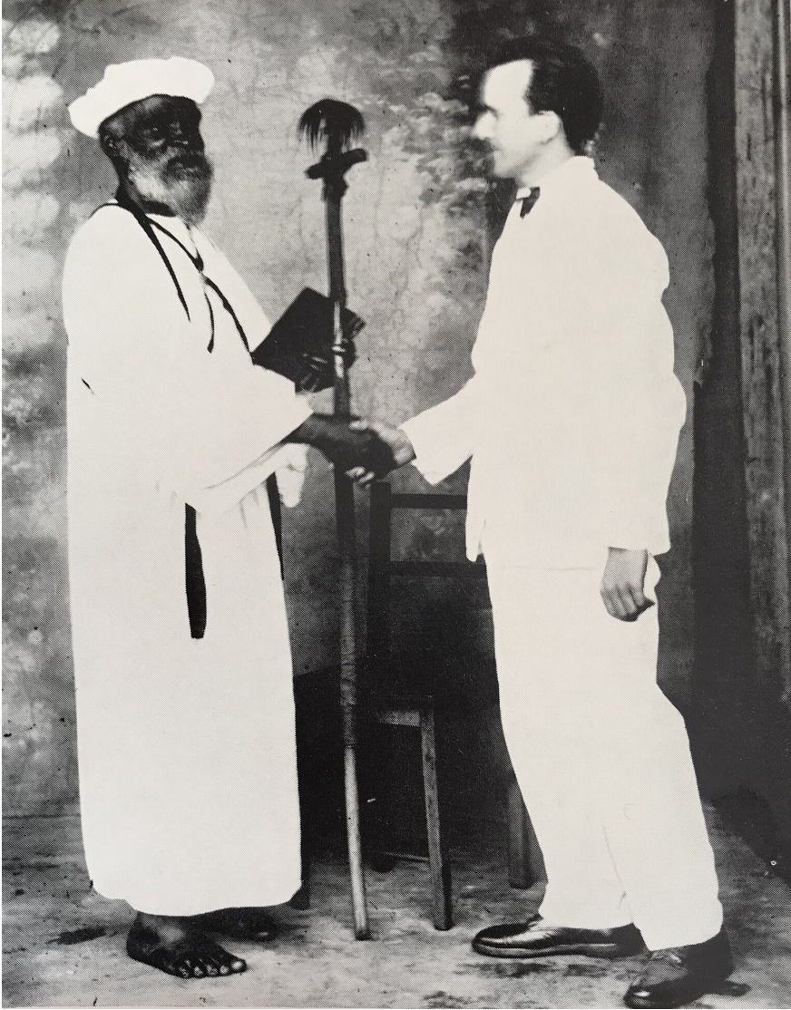
ILLUSTRATION 2 Rencontre entre le pasteur Benoît et le prophète William Wadé Harris (Cape Palmas, 1926)