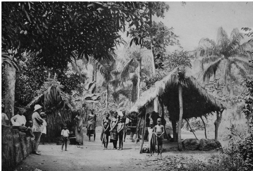
ILLUSTRATION 4 Missionnaire méthodiste en tournée en pays attié, circa 1930 DE BILLY (1931)