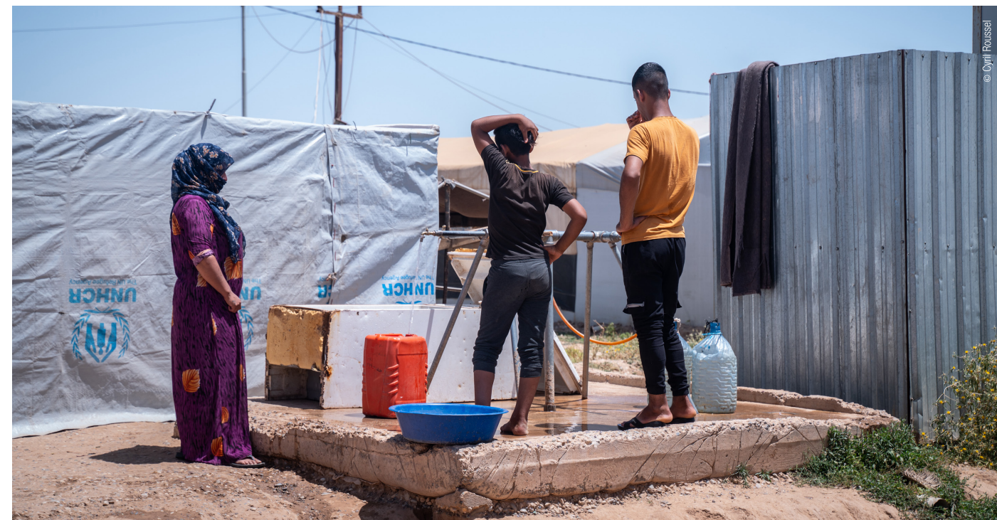
Camp de réfugiés de Mossoul. Plus de 34 000 personnes se sont déplacées à cause du changement climatique dans le centre et sud de l'Irak.