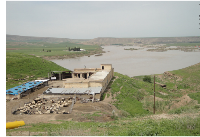
Le Tigre à son entrée en Irak (région de Feshkhabour) : une baisse de plus de la moitié de son débit a été constituée depuis 2018.

En Irak, la pénurie d'eau est devenue systémique : plusieurs rapports décrivent l'assèchement des marais au sud, ainsi qu'un stress hydrique le long des fleuves, qui pousse les agriculteurs à forer plus de puits et à assécher davantage des réserves sous-terraines déjà surexploitées. Aux puits publics qui alimentent les pôles urbains et bourgs ruraux, s'ajoutent des puits privés alimentés par pompes, financés par les agriculteurs aisés. Ces forages, plus profonds, coûtent toujours plus cher au fur et à mesure que les anciens, moins profonds, se tarissent.