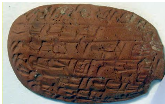
Figure 5 – Seconde page d'une lettre paléo-assyrienne, Kültepe, Kt 93/k 55, Photo : Cécile Michel. Musée des Civilisations Anatoliennes, Ankara.

En revanche, dans les archives privées des marchands de Kaneš (19e siècle) ou les archives royales de Mari (18e siècle), les lettres ont des tailles très variables : ceux ou celles qui les écrivaient adaptaient généralement le format de la tablette au texte qu'ils allaient écrire. Certains marchands assyriens n'y parvenaient cependant pas toujours, formant des tablettes trop petites. Ils étaient alors obligés de poursuivre leur lettre sur une deuxième tablette, en général plus petite, de forme ovale et écrite seulement sur une face (figure 5).