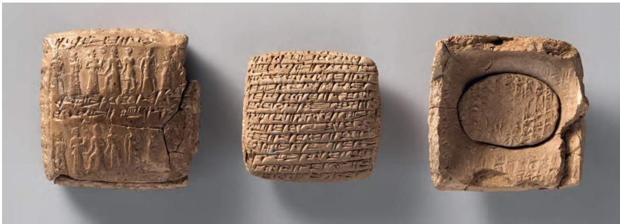
Figure 9 – Deux pages d’une lettre paléo-assyrienne préservées dans leur enveloppe, MET 1983.135.4a,b, Metropolitan Museum of Art, New York.

Lorsque la lettre comportait deux « pages », comme cela était parfois le cas chez les marchands assyriens du 19 e siècle, la tablette et son supplément étaient enfermés ensemble dans une enveloppe. Cette enveloppe permettait d’une part de garder le caractère confidentiel du contenu de la lettre, comme le rappelle la légende d’Ur-Zababa, et d’autre part elle protégeait la tablette lors de son transport (figure 9).