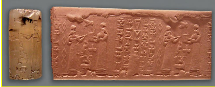
Figure 10 – Sceau-cylindre d'un fonctionnaire du roi Kurigalzu II, Babylonie, xive siècle av. J.-C. AOD 105. Département des Antiquités Orientales du Musée du Louvre, Paris.

Une fois sous enveloppe, la lettre n'était plus modifiable, c'est ce qu'explique Ibal-pī-El au roi de Mari qui avait appris une fausse nouvelle :