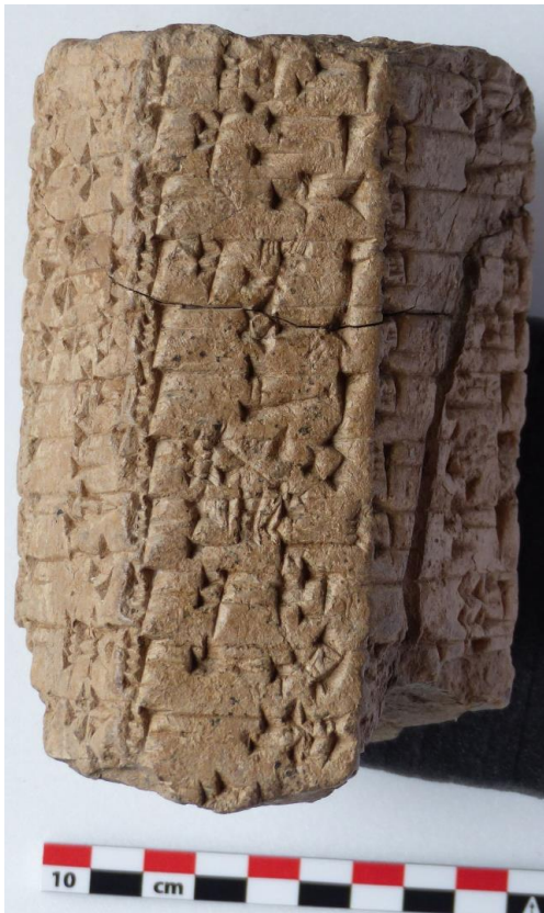
Figure 2 – Prisme en argile contenant une liste lexicale de profession, Tello, période paléobabylonienne, AO 337. Photo : Cécile Michel. Département des Antiquités Orientales du Musée du Louvre, Paris.

comme des poumons ou des intestins. D'autres objets, tels des vases ou d'autres types de vaisselles pouvaient porter un texte court, parfois en relation avec la capacité du récipient.