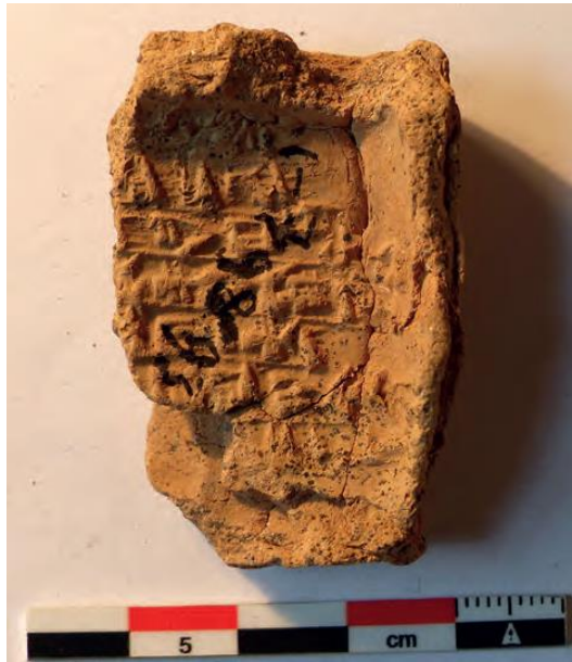
Figure 8 – Fragment d’enveloppe paléo-assyrienne. Les signes de la tablette ont été imprimés en relief sur la face interne de l’enveloppe lors du séchage de cette dernière et de la rétractation de l’argile. Kültepe, Kt 93/k 870, Photo : Cécile Michel. Musée des Civilisations Anatoïennes, Ankara.

Lorsque la lettre comportait deux « pages », comme cela était parfois le cas chez les marchands assyriens du 19 e siècle, la tablette et son supplément étaient enfermés ensemble dans une enveloppe. Cette enveloppe permettait d’une part de garder le caractère confidentiel du contenu de la lettre, comme le rappelle la légende d’Ur-Zababa, et d’autre part elle protégeait la tablette lors de son transport (figure 9).