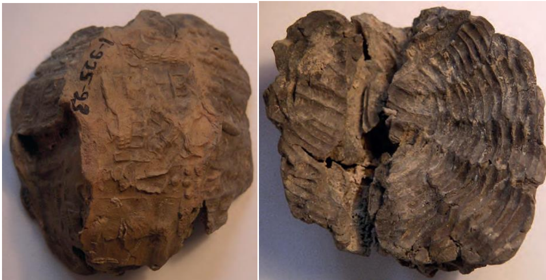
15 – Bulla appliquée sur un panier en roseau dont la structure a laissé son empreinte sur la face interne. La face externe comporte des empreintes de sceau. Kt 93/k 801, Kültepe, Photo : Cécile Michel. Musée des Civilisations Anatoliennes, Ankara.

Les empreintes laissées par différents matériaux, observées sur les faces internes des nombreux scelllements ou bullæ découverts à Kültepe, ont permis, dans certains cas, d’identifier l’usage de ces derniers, voire d’étudier plus en détail les caractéristiques du matériau ayant laissé son empreinte (Michel 2016, Strupler 2021). Certaines de ces bullæ étaient appliquées sur des textiles, qu’il s’agisse de sacs de toile ou de tissus fermant des récipients. L’examen au microscope de ces empreintes de textiles permet, en l’absence de restes archéologique de textiles, d’identifier les techniques de tissage utilisées et la densité du tissage, l’épaisseur des fils, voire la nature animale ou végétale de la fibre (Andersson Strand, Breniquet et Michel 2017). Certains de ces textiles étaient fixés à l’aide de cordes et ficelles qui ont également laissé des empreintes sur l’envers des bullæ (figure 15).