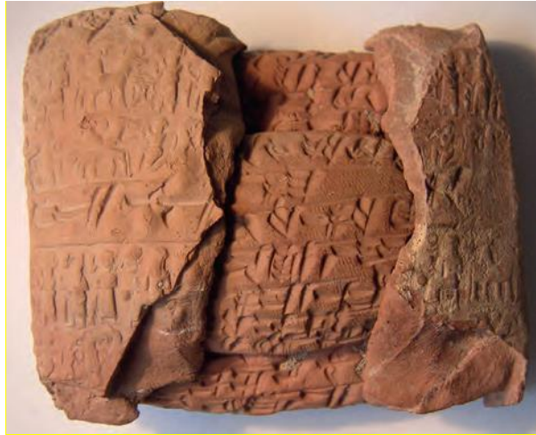
Figure 13 – Lettre sur deux pages dont deux fragments d'enveloppe sont préservés. La surface de la petite deuxième page présente l'empreinte d'un textile qui devait la protéger lors de la confection de l'enveloppe. Kt 93/k 55+120+240+831, Kültepe, Photo : Cécile Michel. Musée des Civilisations Anatoliennes, Ankara.

Parmi les différentes caractéristiques de l'argile, sa plasticité fait qu'elle reproduit facilement la structure des matériaux qui y sont appliqués sur sa surface. Cela explique l'usage intensif de sceaux, qu'il s'agisse de sceaux-cylindres ou de sceaux tampons dont les empreintes figurent sur les enveloppes, parfois sur les tablettes elles-mêmes, ou encore sur différents types de scellements permettant de clore des contenants ou des pièces et d'en identifier le propriétaire ou le responsable. Certains de ces scellements portent également un texte en cunéiforme qui précise leur usage (figure 13).