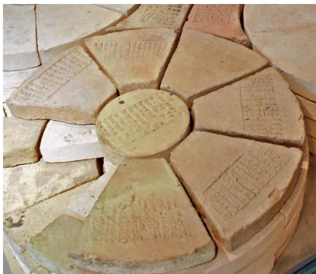
Figure 3 – Briques estampillées utilisées pour le pilier de Gudea, xxi e siècle av. J.-C., AO26671. Photo : Martine Esline. Département des Antiquités Orientales du Musée du Louvre, Paris.

Dans les capitales assyriennes du 1 er millénaire, les archéologues ont mis au jour plus de 170 mains en argile de taille humaine avec un support ou partie d'avant-bras, dont un tiers portent un texte. Ces mains, traditionnellement appelées, peut-être à tort 'main de la déesse Ištar', portent un texte commençant par le nom du souverain assyrien ou par son palais (Frame 1991) ; elles étaient fixées au mur des palais assyriens et devaient avoir une fonction protectrice. 3 Enfin, d'autres types d'éléments architecturaux, comme des briques ou des éléments de piliers pouvaient aussi porter un texte écrit à la main ou plus souvent estampillé à l'aide d'un moule (figure 3).