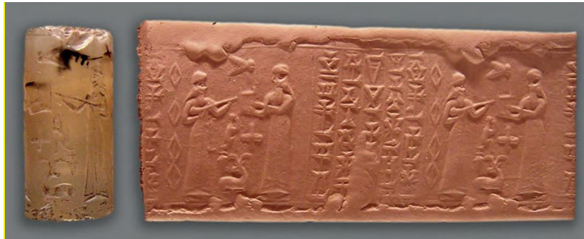
Figure 10 – Sceau-cylindre d'un fonctionnaire du roi Kurigalzu II, Babylonie, xive siècle av. J.-C. AOD 105. Photo : Martine Esline. Département des Antiquités Orientales du Musée du Louvre, Paris.

Une fois sous enveloppe, la lettre n'était plus modifiable, c'est ce qu'explique Ibal-pī-El au roi de Mari qui avait appris une fausse nouvelle :