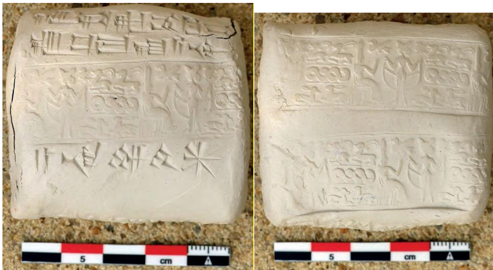
Figure 7 – Fabrication expérimentale d'une enveloppe de tablette. La face présente des craquelures intervenues lors du séchage de l'enveloppe, la tablette étant enfermée à l'intérieur.

Une fois que la tablette avait séché au soleil, après environ deux jours, elle était recouverte d'une mince couche d'argile, d'environ 2 à 3 mm d'épaisseur. Nous ignorons quel outil était utilisé pour obtenir cette fine couche d'argile. L'argile fraîche de l'enveloppe n'adhérait alors pas à celle, bien sèche, de la tablette. Réaliser une enveloppe d'argile parfaitement adaptée à une tablette nécessite une très bonne connaissance des qualités mécaniques de l'argile utilisée. En effet, la rétraction de l'argile au séchage dépend de la qualité de cette dernière. Si l'enveloppe est trop lâche et qu'il y a trop d'air entre la tablette et l'enveloppe, il est quasiment impossible d'écrire du texte sur l'enveloppe et d'y dérouler des sceaux-cylindres (Michel 2020c). En revanche, si l'enveloppe est trop ajustée à la tablette, après quelques heures de séchage, l'argile a tellement rétréci que la tension autour de la tablette est trop forte et que l'enveloppe se fend et finit par se briser (figure 7). Il est important de ce fait, d'observer une épaisseur constante de l'enveloppe sur toutes les faces, y compris sur les tranches, et d'éviter un trop plein d'argile à l'endroit où l'on ferme l'enveloppe.