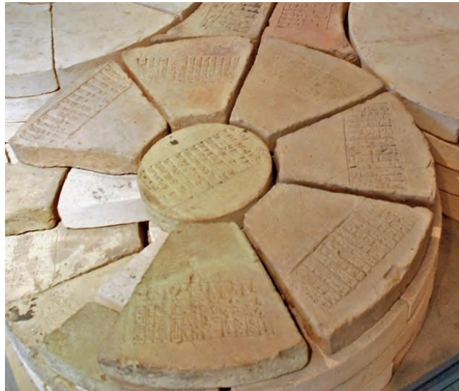
Figure 3 – Briques estampillées utilisées pour le pilier de Gudea, xxi e siècle av. J.-C., AO26671. Photo : Martine Esline. Département des Antiquités Orientales du Musée du Louvre, Paris.

Dans les capitales assyriennes du 1 er millénaire, les archéologues ont mis au jour plus de 170 mains en argile de taille humaine avec un support ou partie d'avant-bras, dont un tiers portent un texte. Ces mains, traditionnellement appelées, peut-être à tort 'main de la déesse Ištar', portent un texte commençant par le nom du souverain assyrien ou par son palais (Frame 1991) ; elles étaient fixées au mur des palais assyriens et devaient avoir une fonction protectrice. 3 Enfin, d'autres types d'éléments architecturaux, comme des briques ou des éléments de piliers pouvaient aussi porter un texte écrit à la main ou plus souvent estampillé à l'aide d'un moule (figure 3).