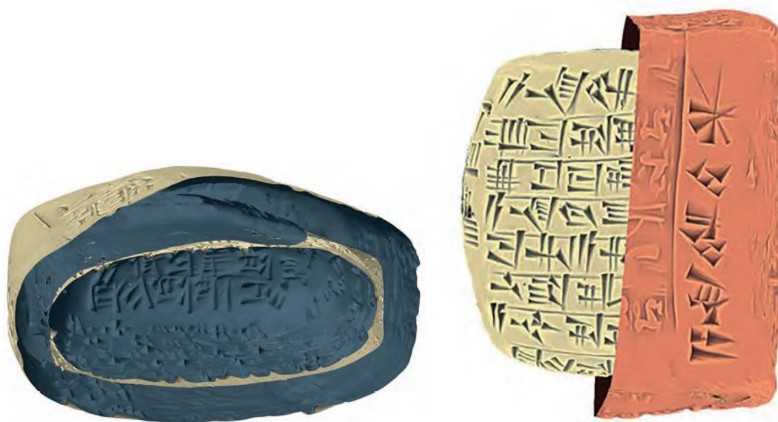
Figure 12 – Images résultant d'un scanner testé sur une enveloppe expérimentale, Cécile Michel, Stephan Olbrich, Christian Schroer. © Understanding Written Artefacts, Project RFA9, Hambourg.

La conservation des enveloppes des lettres depuis l'Antiquité est extrêmement instructive : non seulement l'enveloppe dévoile les patronymes des correspondants, généralement absents des en-têtes des missives, elle révèle les propriétaires ou utilisateurs des sceaux anépigraphes, mais également elle préserve ensemble les deux pages de la lettre, séparées lorsque l'enveloppe est ouverte. En outre, les fragments d'enveloppe découverts sur le site de Kültepe ont permis de reconstituer la manière dont elles étaient façonnées, la fermeture de l'enveloppe se faisant généralement sur la face ou le revers par le chevauchement de deux fines couches d'argile soudées ensemble et aplaties (Michel 2020c).