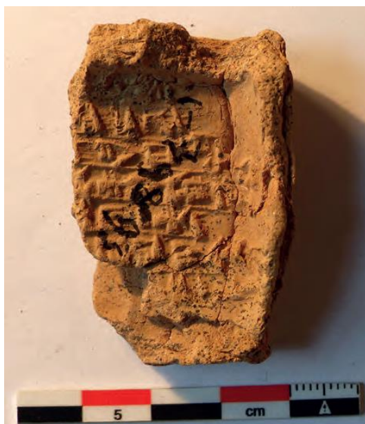
Figure 8 – Fragment d’enveloppe paléo-assyrienne. Les signes de la tablette ont été imprimés en relief sur la face interne de l’enveloppe lors du séchage de cette dernière et de la rétractation de l’argile. Kültepe, Kt 93/k 870, Musée des Civilisations Anatoliennes, Ankara.

Lorsque la lettre comportait deux « pages », comme cela était parfois le cas chez les marchands assyriens du 19 e siècle, la tablette et son supplément étaient enfermés ensemble dans une enveloppe. Cette enveloppe permettait d’une part de garder le caractère confidentiel du contenu de la lettre, comme le rappelle la légende d’Ur-Zababa, et d’autre part elle protégeait la tablette lors de son transport (figure 9).