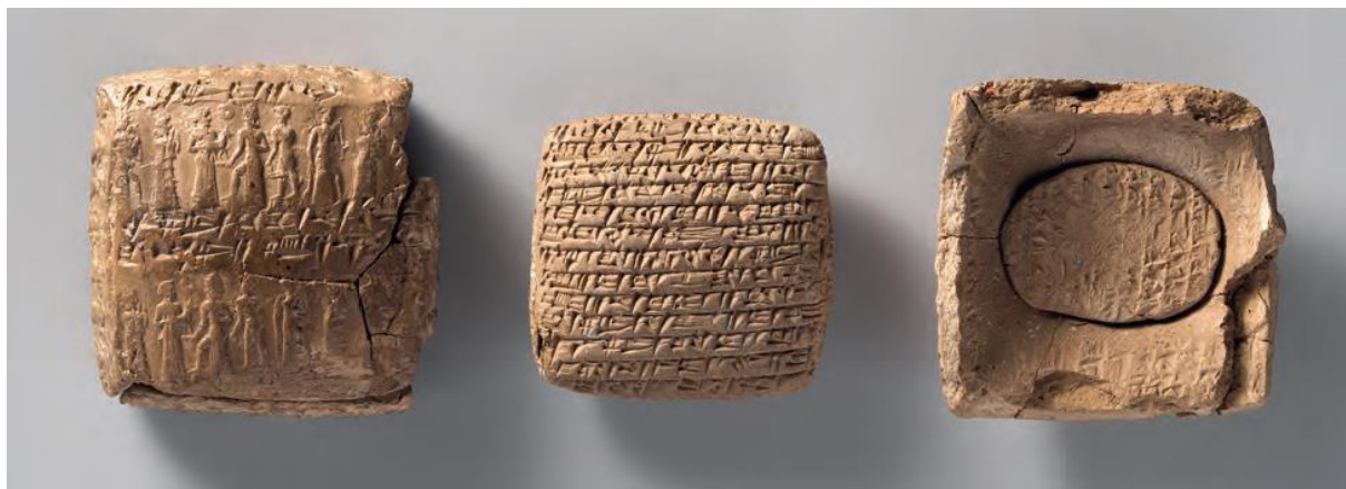
Figure 9 – Deux pages d’une lettre paléo-assyrienne préservées dans leur enveloppe, MET 1983.135.4a,b, Metropolitan Museum of Art, New York. https://www.metmuseum.org/art/collection/search/326712 consultée le 12 décembre 2021.

Lorsque la lettre comportait deux « pages », comme cela était parfois le cas chez les marchands assyriens du 19 e siècle, la tablette et son supplément étaient enfermés ensemble dans une enveloppe. Cette enveloppe permettait d’une part de garder le caractère confidentiel du contenu de la lettre, comme le rappelle la légende d’Ur-Zababa, et d’autre part elle protégeait la tablette lors de son transport (figure 9).