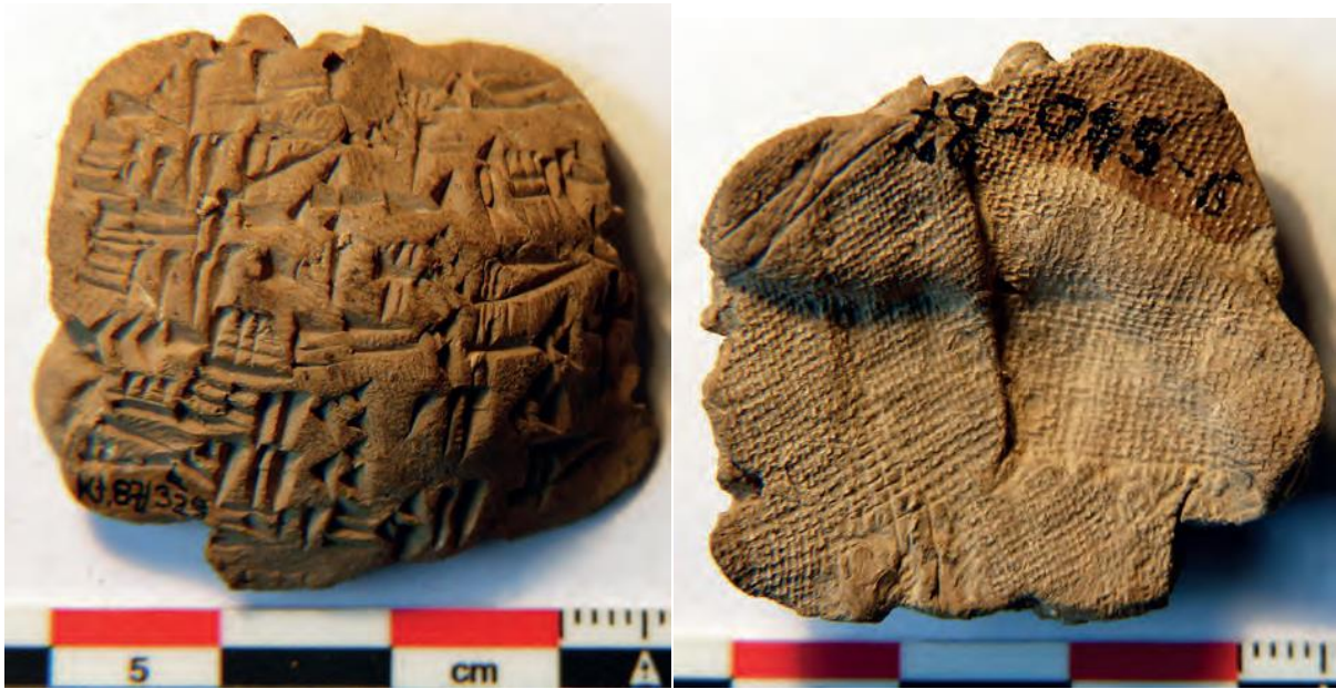
Figure 14 – Face externe et face interne d'une bulla d'argile qui était appliquée sur un textile dont l'empreinte montre une toile. Kt 87/k 329, Kültepe, Musée des Civilisations Anatoliennes, Ankara.

Les empreintes laissées par différents matériaux, observées sur les faces internes des nombreux scelllements ou bullæ découverts à Kültepe, ont permis, dans certains cas, d'identifier l'usage de ces derniers, voire d'étudier plus en détail les caractéristiques du matériau ayant laissé son empreinte (Michel 2016, Strupler 2021). Certaines de ces bullæ étaient appliquées sur des textiles, qu'il s'agisse de sacs de toile ou de tissus fermant des récipients. L'examen au microscope de ces empreintes de textiles permet, en l'absence de restes archéologique de textiles, d'identifier les techniques de tissage utilisées et la densité du tissage, l'épaisseur des fils, voire la nature animale ou végétale de la fibre (Andersson Strand, Breniquet et Michel 2017). Certains de ces textiles étaient fixés à l'aide de cordes et ficelles qui ont également laissé des empreintes sur l'envers des bullæ (figure 15).