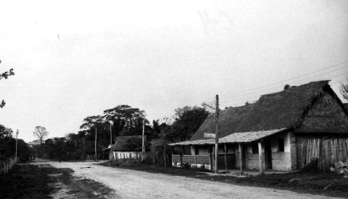
Figura 2. Casarabe con tormenta.

gherty y Calandra no habían dejado Moxos repentinamente. En lugar de ello habían registrado meticulosamente, a través de estos medios, una gran cantidad de fragmentos cerámicos, los que lamentablemente luego fueron destruidos. Asimismo, habían confeccionado láminas, elaborado tablas cronológicas y clasificado el material por fases. ¿Por qué ese trabajo nunca fue publicado? Esa incógnita permanecerá sin respuesta. Sin embargo, gracias al proyecto SciCoMove , ahora sabemos que Dougherty y Calandra no se limitaron únicamente a investigar los montículos monumentales de la zona central de los Llanos de Moxos, en la provincia Cercado y Moxos. También se embarcaron en un extenso recorrido por toda la región, documentando materiales arqueológicos del oeste de los Llanos (río Beni), del norte (Riberalta) y del este (río Iténez). Además, preservaron toda la correspondencia relacionada con el Instituto Smithsonian sobre cada uno del casi medio centenar de fechados radiocarbónicos obtenidos, una cifra notable considerando la época en la que llevaron a cabo sus investigaciones. Realizaron, sin dudas, un registro detallado de la cerámica de cada sitio, que incluyó dibujos, fotografías y descripciones de sus atributos tecnológicos.