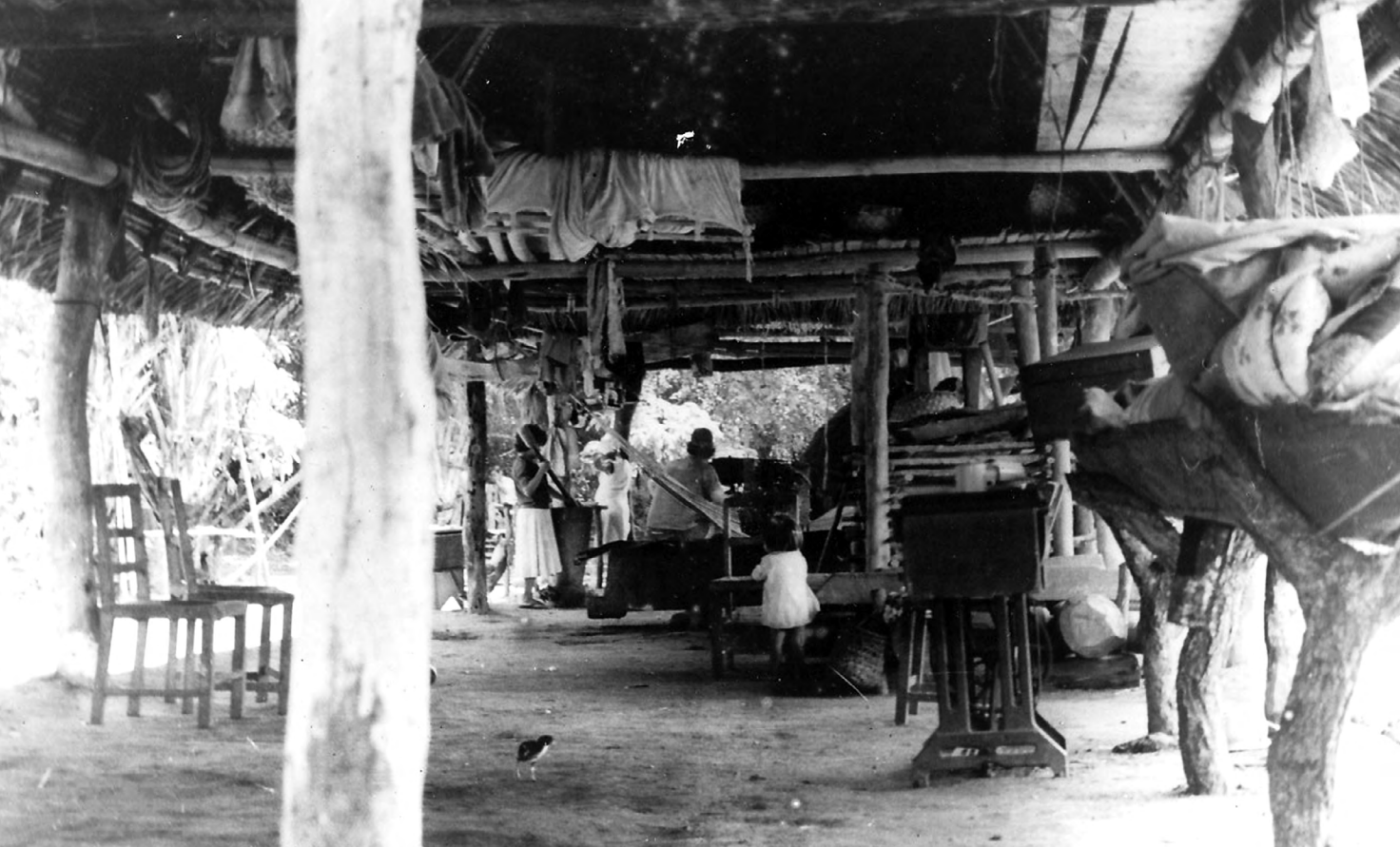
Figura 3. Familia del Beni.

se encontraban numeradas y se identificó un cuaderno de la marca “Tamborcito” que contenía el registro de 2.305 fotografías, muchas de las cuales se relacionan con la región de Moxos, mientras que otras corresponden a áreas del Chaco argentino (Figuras 4 y 5). Este cuaderno, aunque pueda parecer insignificante a simple vista, representa una auténtica joya para contextualizar las fotografías halladas. De cualquier manera, resulta sorprendente que Dougherty hubiera reunido esta valiosa información de manera centralizada en un único cuaderno, y aún más que dicho cuaderno haya aparecido en uno de los escritorios de la División de Arqueología del Museo de La Plata, el mismo que usaba en vida.