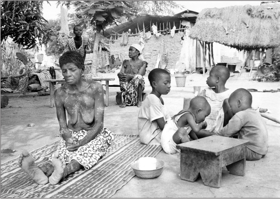
Les enfants mangent les restes du repas de la veuve (funérailles de Koffi Brou, Kangandissou, le 5 décembre 1996).

funérailles anyi, de nouvelles expressions festives du triomphe de la vie sur la mort, dans la continuité du noolo . Beaucoup de veillées sont aujourd'hui animées par un DJ qui fait écouter les cassettes des artistes régionaux et nationaux, musiques sur lesquelles dansent surtout les plus jeunes. Par ailleurs, lorsque le défunt est de confession chrétienne, la chorale de l'Église (catholique ou protestante) tient désormais une place importante au cours de ces veillées religieuses. Enfin, expressions du statut social du défunt mais aussi de la situation économique de sa famille, l'animation musicale – tout comme la nourriture et la boisson – est plus que jamais essentielle lors de ces cérémonies : certaines veillées funéraires qui souvent ont lieu le samedi soir sont ainsi appelées « Tonnerre » – nom d'une émission de variétés télévisée ivoirienne très populaire – parce qu'on est certain de bien s'amuser toute la nuit tandis que celles qui sont organisées par une famille pauvre sont qualifiées de « Bal poussière ». Si la célébration des funérailles évolue rapidement en pays anyi 15 , ces changements, en définitive, concernent, davantage la forme que l'esprit !