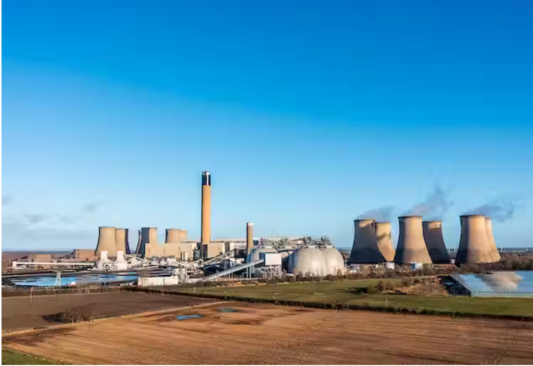
Image panoramique de la centrale Drax dans le nord du Yorkshire (Royaume-Uni) avec réservoirs de stockage de carburant Biomass et capacités de capture du carbone.