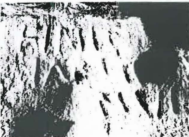
Fig. 57

L'étymologie du mot, toponyme attesté ailleurs au Liban (Freyha 1956: 363; au nord de Assia, mohafazat de Batroun), le ra ache peut-être à l'araméen yr̄ša qui désigne ce qui est hérité (Wild 1973: 160: «Geerbtes, Erbland»); s'agit-il d'un terrain donné au dieu en héritage ? Toutefois la vocalisation de la première syllabe est différente de l'araméen; S. Wild la mettait en relation avec l'influence de l'arabe ( yamm ), ce qui serait étonnant à cette date. Il est tentant d'identifier le toponyme de Larith avec le nom antique du territoire dépendant du sanctuaire d'Afqa.