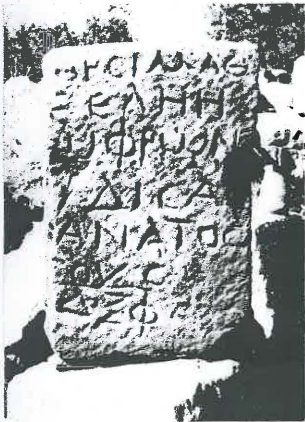
Fig. 56 - L'inscription grecque (Archives DGA).

Une autre découverte récente (information et photo communiquées par P.-L. Gatier et C. Atallah) vient compléter le dossier de Iarith. Plus haut dans la montagne, au sud des inscriptions précédentes, sur la