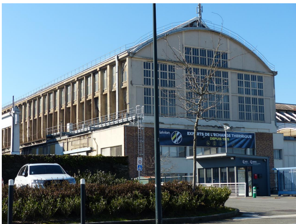
Photographie 6 : Grande nef (surnommée « la Cathédrale » par les ouvriers) de l'usine de Batignolles, actuellement occupée par l'entreprise Kelvion

Dans un quartier soumis à une très forte pression foncière, la ville souhaitait de toute évidence éviter de surprotéger une vaste emprise foncière comme celle des Batignolles ; sans forcément envisager que certaines nefs soient détruites (mais rien n'était garanti), il fallait visiblement laisser les mains libres aux investisseurs publics et privés. Mais finalement le paysage urbain de ce quartier gardera cette mémoire industrielle monumentale : par arrêté du 22 août 2022, « l'État, en lien avec les collectivités locales, les associations patrimoniales attachées à la protection du site et les propriétaires