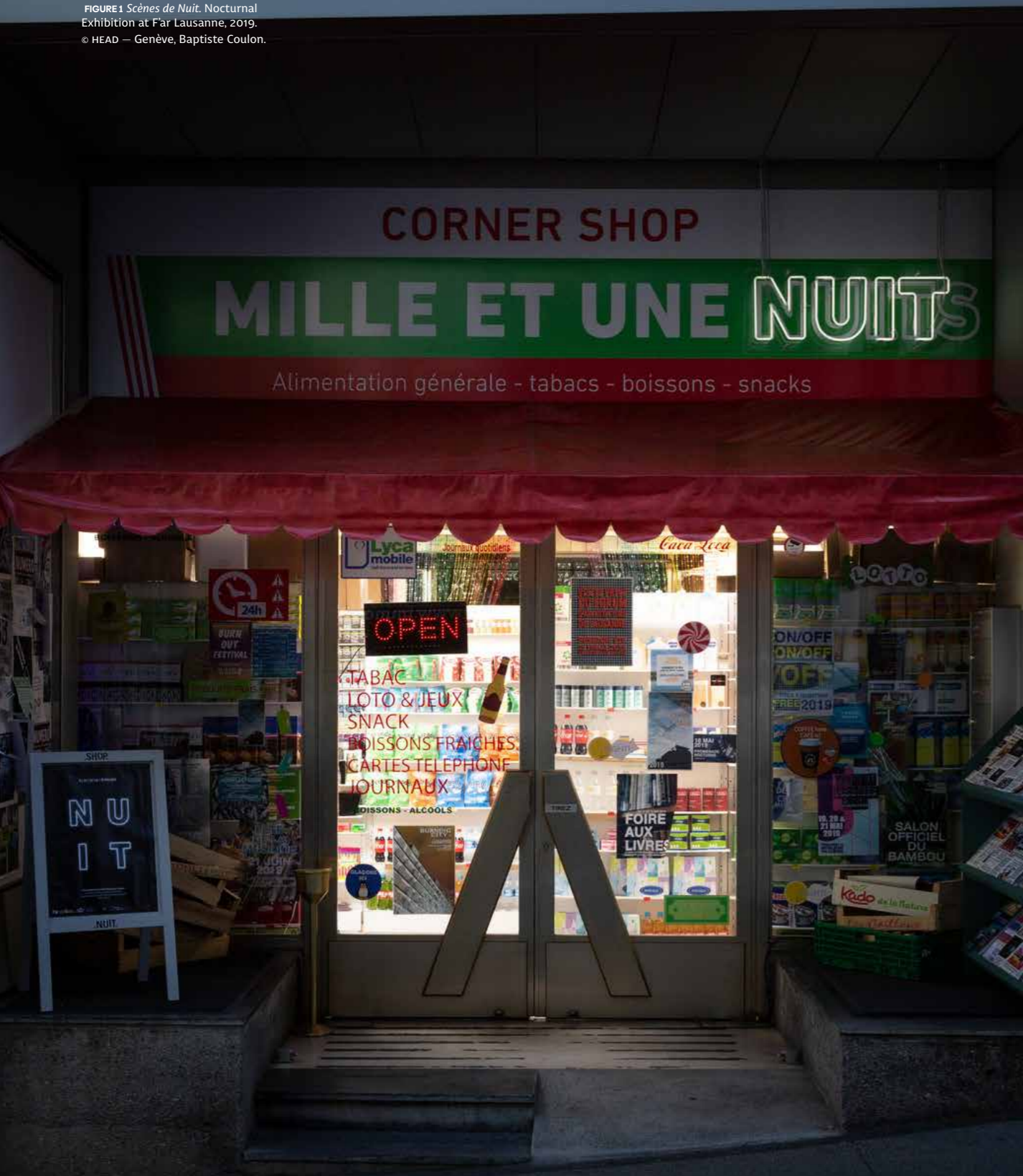
FIGURA1 Scènes de Nuit . Exposición nocturna en F'ar Lausanne, 2019. FIGURE1 Scènes de Nuit . Nocturnal Exhibition at F'ar Lausanne, 2019.