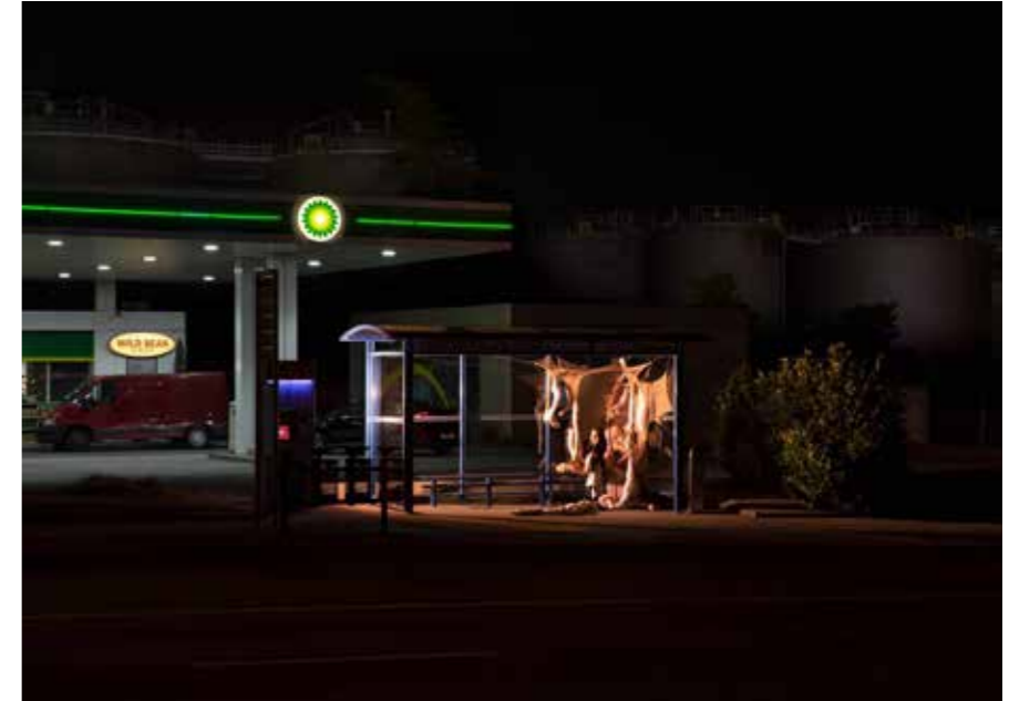
FIGURA 10 FIGURE 10 Des Corps dans la Nuit , 2022.

Our agenda to explore the entanglements between night and architecture has always been public and explicit, aiming to construct discussions and exchanges to intellectually nourish the project. In this sense, it is worth mentioning the ‘Unbeleuchtet’ lecture held in December 2021 at HEAD — Genève, where leading figure of architectural photography, Bas Princen, discussed with Javier F. Contreras and Leonid Slonimskiy how unlit spaces define the contemporary urban landscape and architecture through the use of photography. Also, the ‘Nocturnal Perspectives’ lecture series held in winter 2021 under the curation of Vera Sacchetti included lectures such as ‘Images that Change the Way We See’ by Elliot Woods, who discussed the work of South Korean duo Kimchi and Chips, focusing on the role of artworks