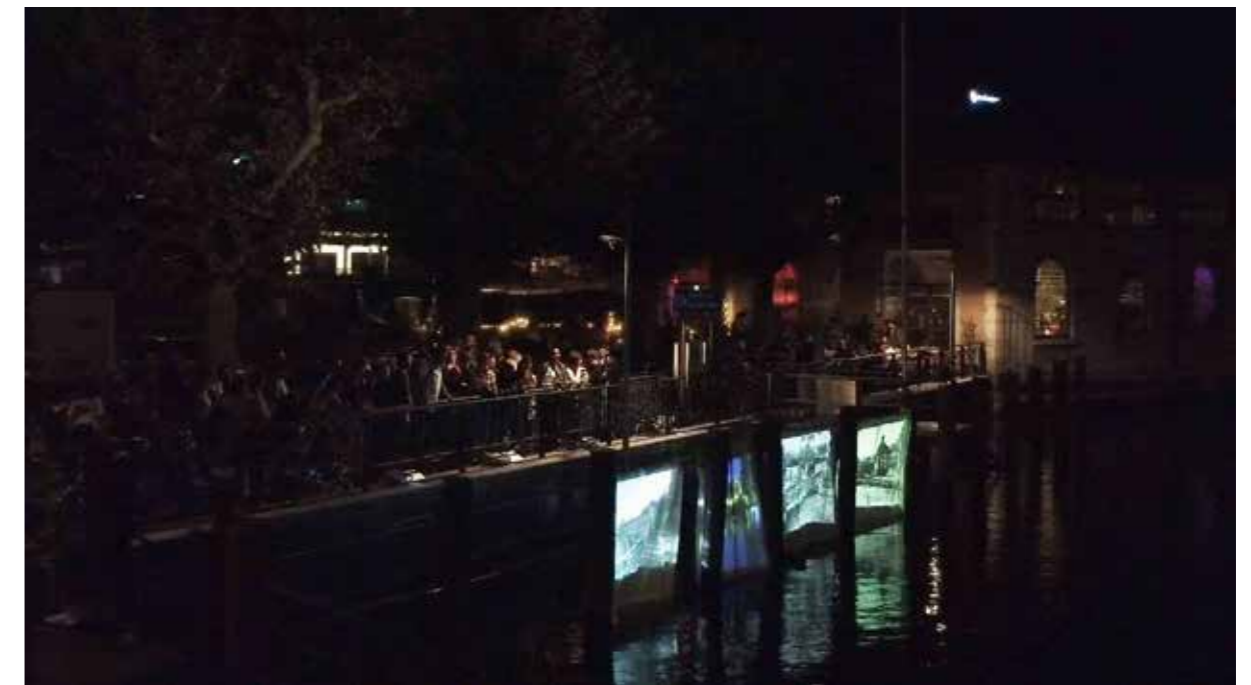
FIGURA 11 FIGURE 11 After Sunset, Before Sunrise , 2021. © HEAD — Genève.