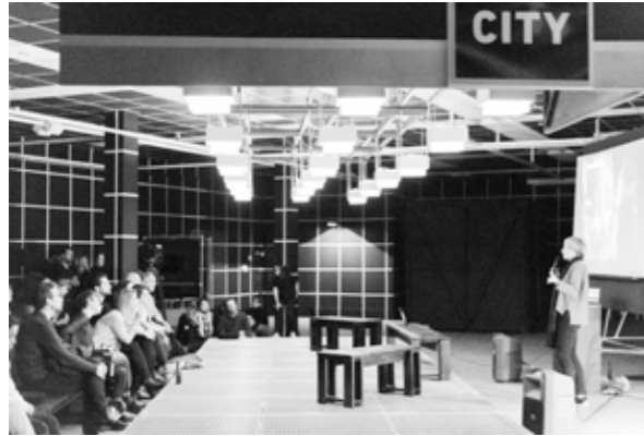
FIGURA 3 Scènes de Nuit . Exposición nocturna en F'ar Lausanne, 2019. FIGURE 3 Scènes de Nuit . Nocturnal Exhibition at F'ar Lausanne, 2019.