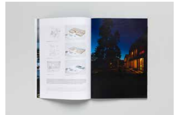
FIGURAS 8-9 FIGURES 8-9 El Croquis Night , 2020.