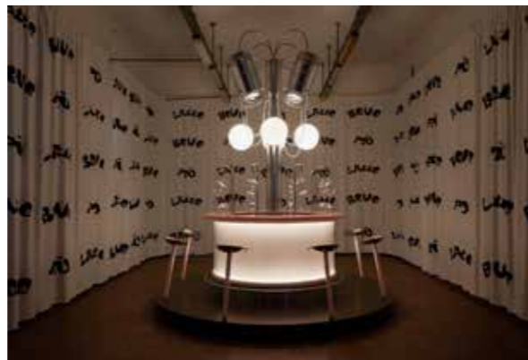
FIGURAS 4-5 Milk Bar . Semana del Diseño de Milán, 2021. FIGURES 4-5 Milk Bar . Milan Design Week, 2021.