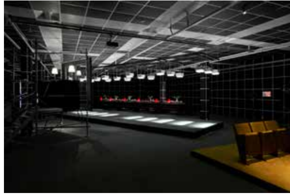
FIGURA 2 Scènes de Nuit . Exposición nocturna en F'ar Lausanne, 2019. FIGURE 2 Scènes de Nuit . Nocturnal Exhibition at F'ar Lausanne, 2019.