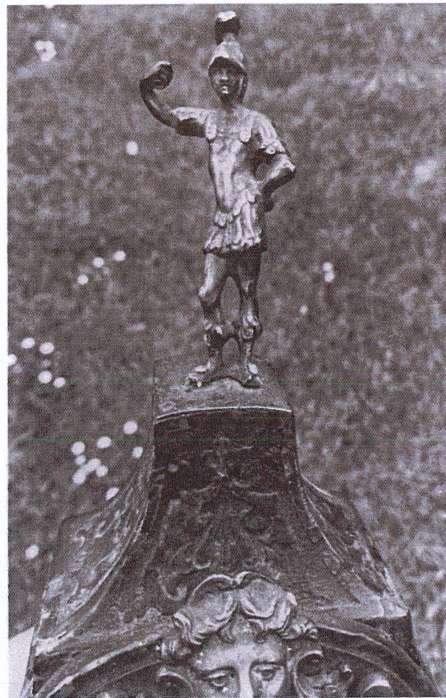
Fig. 2 : a) Porte-montre à cartel violonné en marqueterie Boulle de laiton sur fond d'écaille et ornements en bronze de style Régence (Lyon, collection particulière) (PRESSOUYRE 1966, p. 253) ; b) Détail d'un autre porte-montre à cartel violonné en marqueterie Boulle avec la statuette sommitale du dieu Mars.