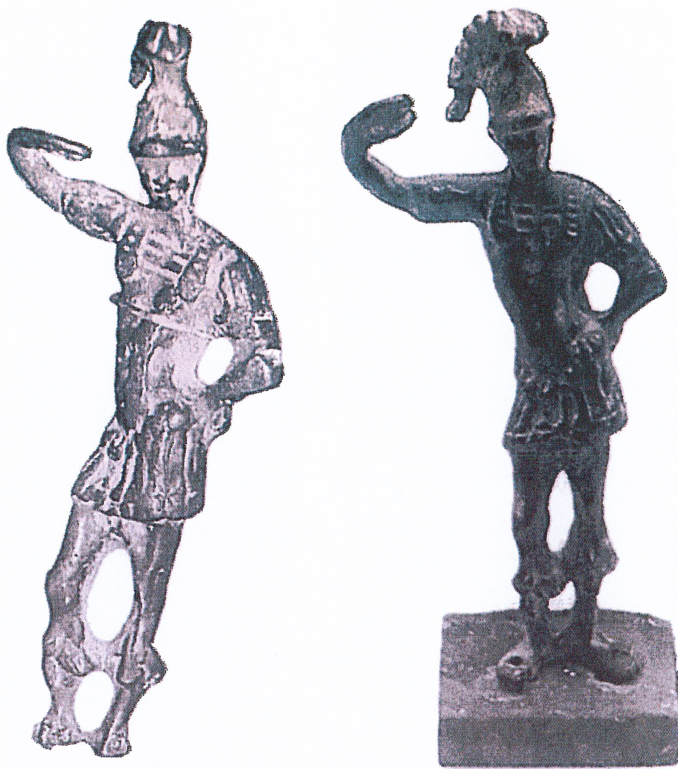
Fig. 1 : Statuette de Mars : a) Exemple du Musée d'Art et d'Histoire de Melun ; b) Exemple du Musée d'Art et d'Histoire Saint-Léger de Soissons.

bavure de coulée non éliminée au niveau des pieds, des mollets et de l'entrejambe ; jambes, torse et bras droit difformes, avec étirement et déhanchement excessifs évoquant un style