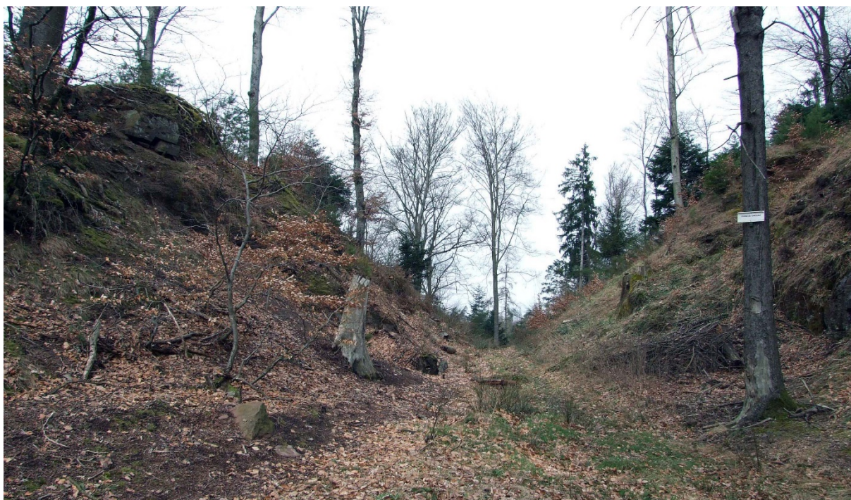
Fig. 7 – Le fossé-carrière du château de Beauregard à Raon-L'Étape (Vosges) (C. Moulis).

Haute-Seille (Cirey-sur-Vezouze, Meurthe-et-Moselle, au moins les bâtiments modernes) présentent des fronts encore visibles sur plusieurs mètres. Le cas des carrières des châteaux de Ham et Varsberg (Ham-sous-Varsberg, Moselle) est semblable, à ceci près que les carrières sont à proximité immédiate du site et sont peu altérées par le recouvrement car installées sur l'arête qui jouxte la butte où se tiennent les vestiges des deux châteaux. Sur certains fronts, l'agencement des traces de redressement au pic ou à l'escoude permet de déceler la logique d'extraction sous-jacente, car certaines tranchées restent partiellement identifiables ( fig. 8 ).