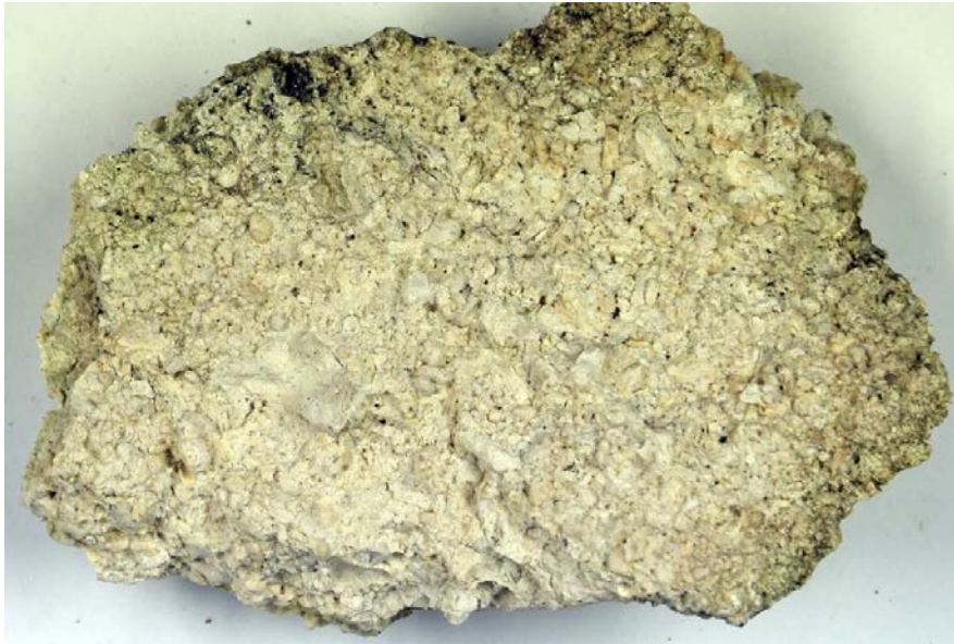
Fig. 3 – Calcaire corallien de l’Oxfordien moyen dans le secteur de Mureau (Vosges).