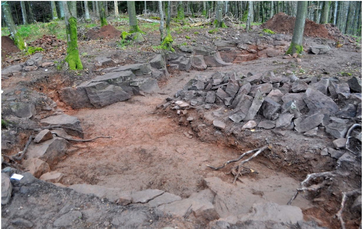
Fig. 5 – La carrière de grès du Streitwald (Moselle) en cours de fouille : le front réduit à un seul ban fait face à un tas de blocs extraits (C. Moulis).

empreinte dans le paysage est donc minime et seule une prospection minutieuse permet de retrouver les plus petites. Une des carrières du château d'Ischeid dans les bois du Streitwald à Abreschwiller (Moselle) a ainsi pu être localisée lors d'une prospection pédestre à environ 500 m du chantier de construction (fig.5). Seuls les derniers blocs d'extraction de petite taille d'une zone de stockage surnageaient par-delà l'humus. Cette carrière a d'abord été associée au parcellaire antique qui composait les lieux avant l'apparition de la couverture forestière. C'est la fouille qui a permis de confirmer son caractère, sa datation et sa destination (Heckenbenner, Moulis et alii. 2018, p. 509-510).