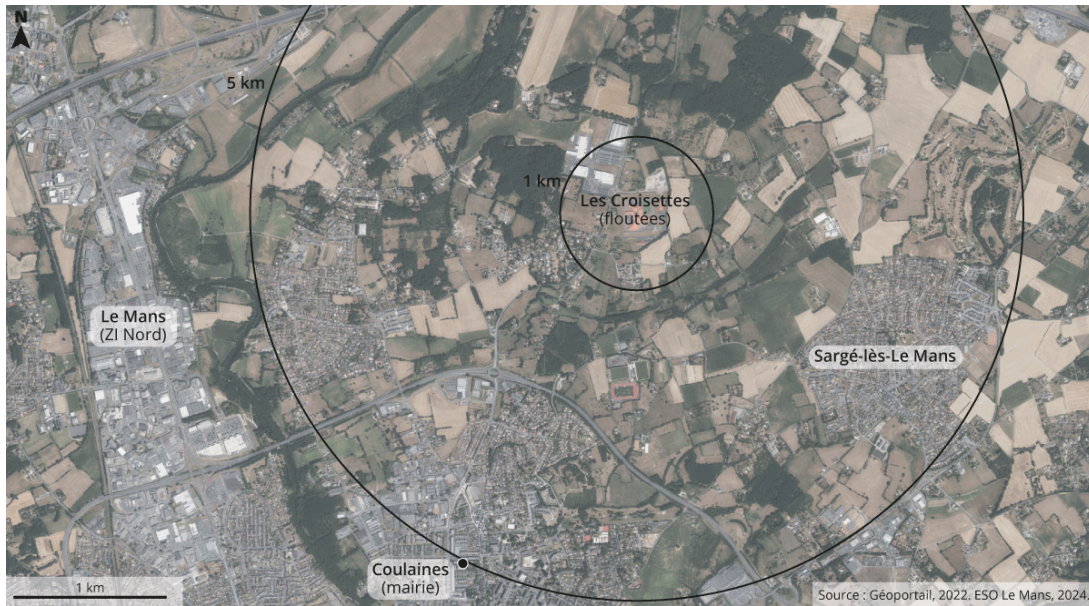
Fig 3 - La prison de Coulaines, une rupture avec le tissu urbain environnant