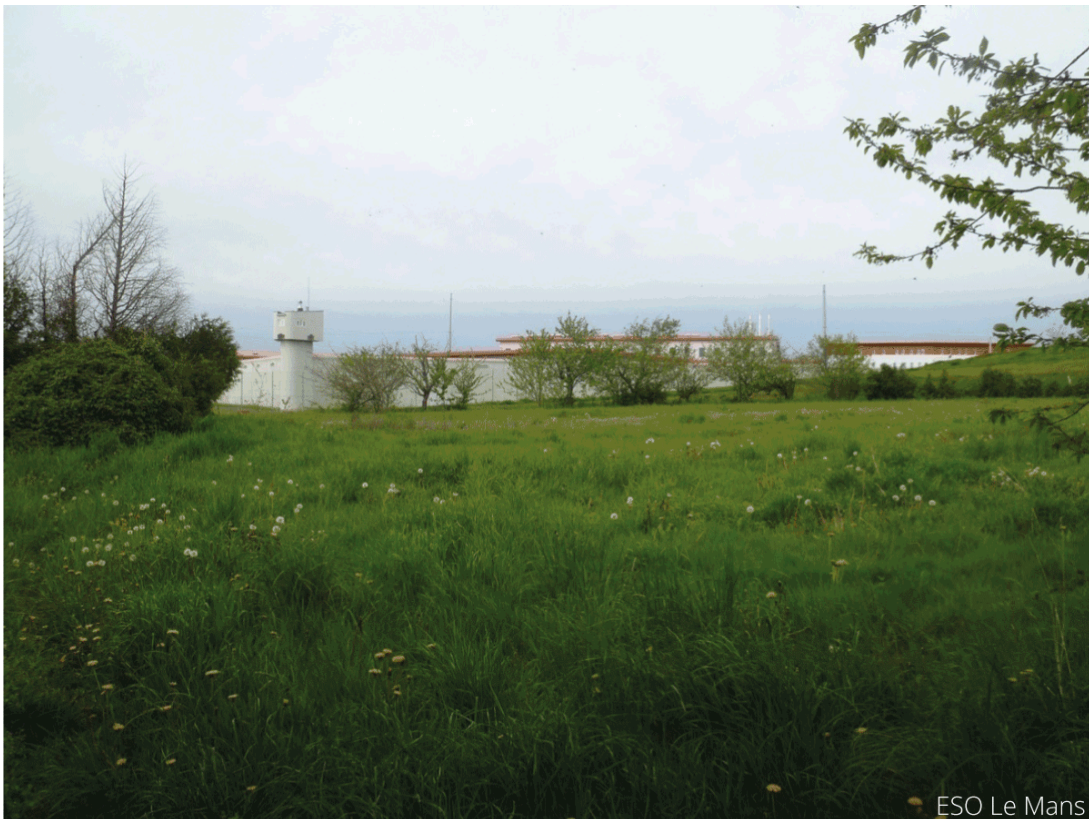
Fig 4 - La prison de Coulaines, une prison en rase campagne