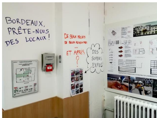
Figure 6. Le B.O.C.A.L : Graffitis réalisés sur les murs pour interpeller les élus locaux lors de la soirée de clôture de l'occupation du lieu, le 14 octobre 2019

Fin 2018, le bailleur fait intervenir un acteur extérieur à la métropole, médiatique et réputé au niveau national pour sa maîtrise des occupations transitoires, Plateau Urbain. Avec Le B.O.C.A.L, 600 m 2 d'ateliers et de bureaux sont loués à bas coût via des baux de 7 mois à 2 ans, au profit de « porteurs de projets émergents ou à fort impact social 34 » (figures 5 et 6). Le recours à un intermédiaire extérieur permet un encadrement fort du projet, pour éviter conflits et débordements et ainsi rassurer les acteurs locaux de l'urbanisme : « on voulait faire cette démonstration que l'occupation temporaire n'est pas toujours la situation de Darwin et qu'il pouvait s'organiser et s'inscrire dans un temps et surtout un contrat clair » explique le directeur de l'aménagement urbain du bailleur 35 . De la sorte, Aquitanis développe de nouvelles compétences en vue de développer des projets transitoires à Bordeaux.