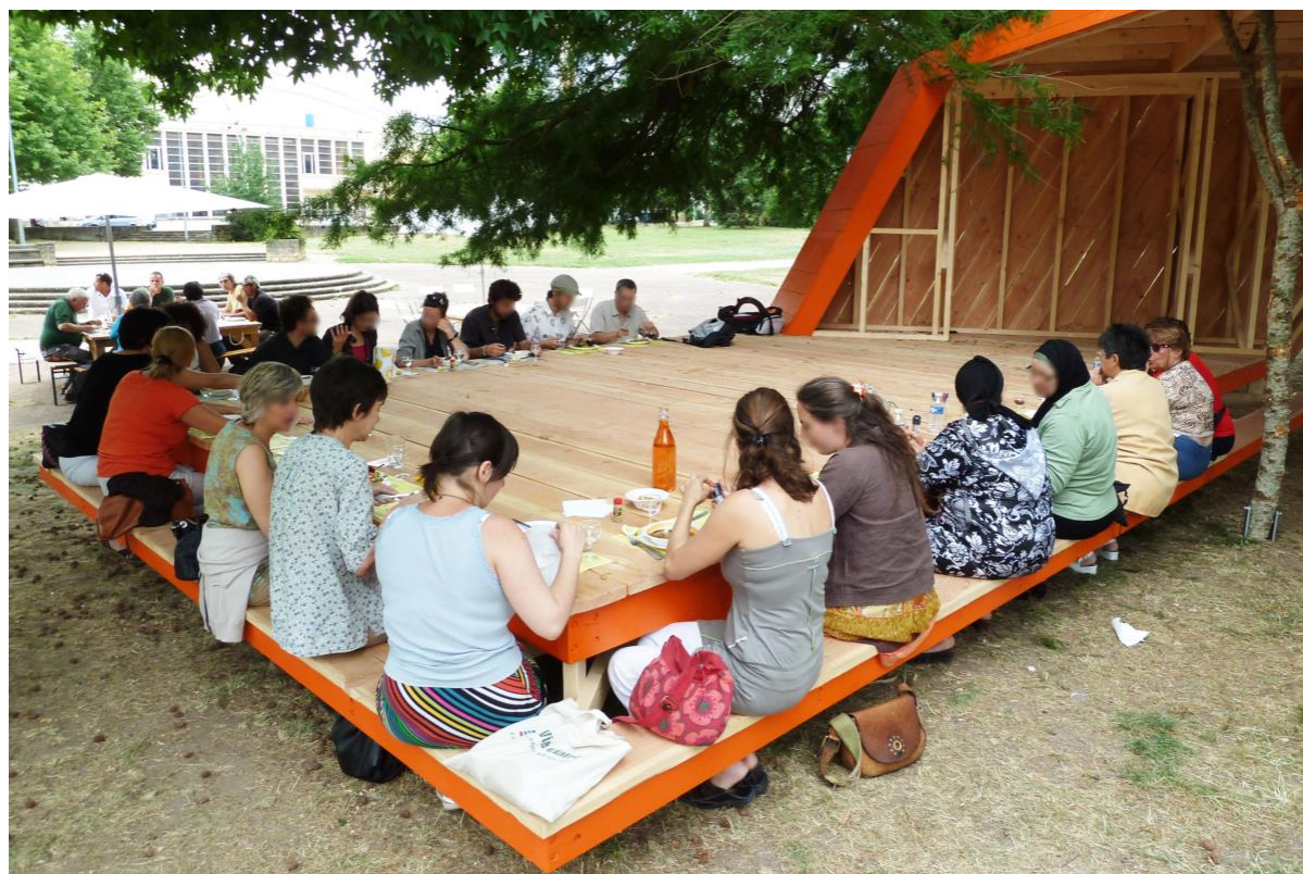
Figure 2. Le Braséro, un « dispositif d'activation et de prospective urbaine » imaginé par Bruit du Frigo dans le quartier Benauges (Bordeaux).

Lormont dans le cadre d'une manifestation culturelle initiée et produite par le GPV Rive droite 19 , a été réinstallé l'année suivante pour six mois avant d'être pérennisé, ouvrant la voie à la création de dix autres refuges jalonnant un circuit de randonnée autour de la métropole. Aménagements minimalistes, d'entretien facile, ils créent des usages dans des marges aux qualités paysagères importantes.