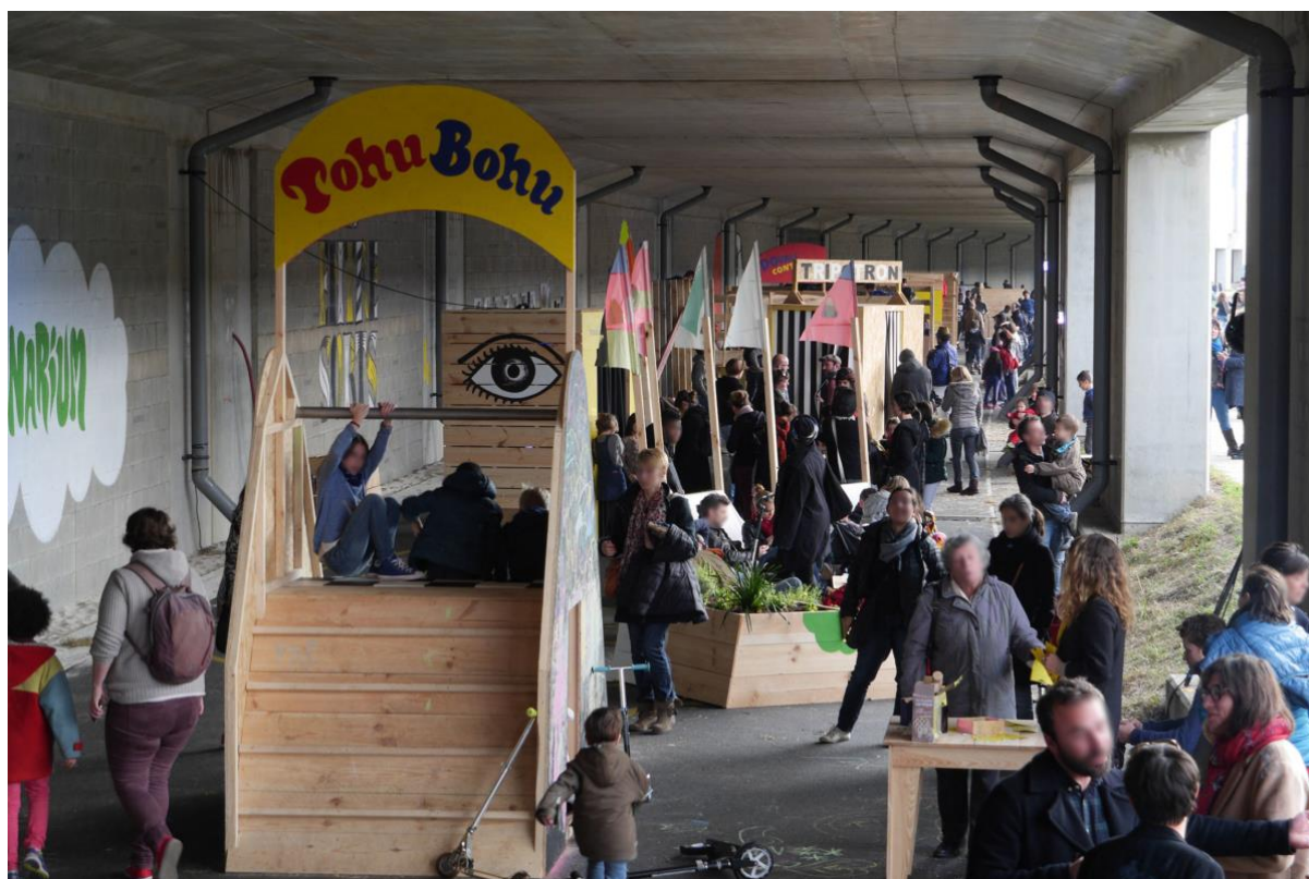
Figure 4. Le "Tube", une expérimentation urbaine sous le viaduc de la LGV à Cenon.

Parallèlement, le nombre de projets temporaires dans l'espace public augmente (16 projets en quatre ans) et les types d'espaces concernés se diversifient. Pour la première fois, des emprises ferroviaires sont occupées en 2016 afin de préfigurer des usages sous ouvrage d'art ferroviaire (figure 4) 31 . Les premières expérimentations de fermeture de voirie ont lieu en 2017 sur le Pont de pierre, pont principal et historique de la ville. Si le recours à des aménagements temporaires dans l'objectif de réduire l'emprise des véhicules motorisés sur la voirie n'est pas nouveau dans les villes françaises et européennes, cette expérimentation va plus loin : non seulement elle concerne un axe majeur de la métropole – en termes de flux de circulation comme d'un point de vue symbolique – mais la fermeture s'étend sur plusieurs semaines et elle est pensée d'emblée dans une optique de réaménagement à court terme.