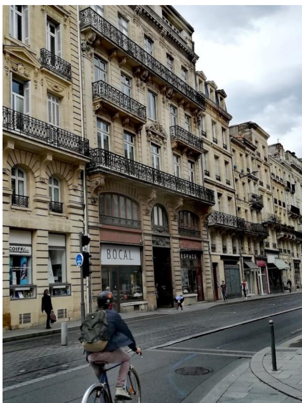
Figure 5. Le B.O.C.A.L : Immeuble ancien du centre-ville de Bordeaux, propriété de Nexity Patrimoine et Projet, transformé en lieu d'occupation temporaire (de décembre 2018 à octobre 2019) géré par Aquitanis dans le cadre de la gestion de son premier projet temporaire issu du partenariat avec Plateau Urbain

En parallèle, un bailleur social, Aquitanis, intéressé par les pratiques de l'urbanisme transitoire, fait appel en 2015 aux agences locales pour intervenir sur un projet : les Sècheries, « parc habité » de 9 hectares situé à Bègles, où logements et équipements collectifs s'insèrent dans un espace paysager. Deux-Degrés est missionnée dans la phase de travaux pour assurer sa médiation, via des outils visant l'appropriation des espaces collectifs par les habitants (modules en bois, dessins d'enfants, pique-nique, ateliers).