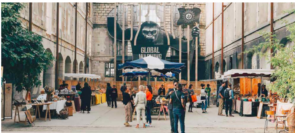
Figure 3. L'Écosystème Darwin, Bordeaux. Vue de la Halle Singe et de son activation.

Ce qui s'appellera plus tard « l'Écosystème Darwin » est un projet privé, dont les fondateurs 23 sont des anciens cadres supérieurs avec un profil très différent de celui des membres collectifs évoqués précédemment. Opérant une bifurcation dans leur trajectoire professionnelle, ils s'associent en 2007 avec à leur disposition une capacité de financement considérable 24 . Ils ciblent l'ancienne caserne Niel, initialement promise à la démolition et devenue un haut lieu des cultures urbaines, pour en faire un lieu d'expérimentation. À la recherche d'une vitrine pour le futur quartier Bastide Niel 25 , la Communauté urbaine de Bordeaux (CUB) soutient le projet, de même qu'Alain Juppé qui y voit un argument de poids dans le dossier de candidature de la Ville de Bordeaux pour le concours de Capitale européenne de la culture.