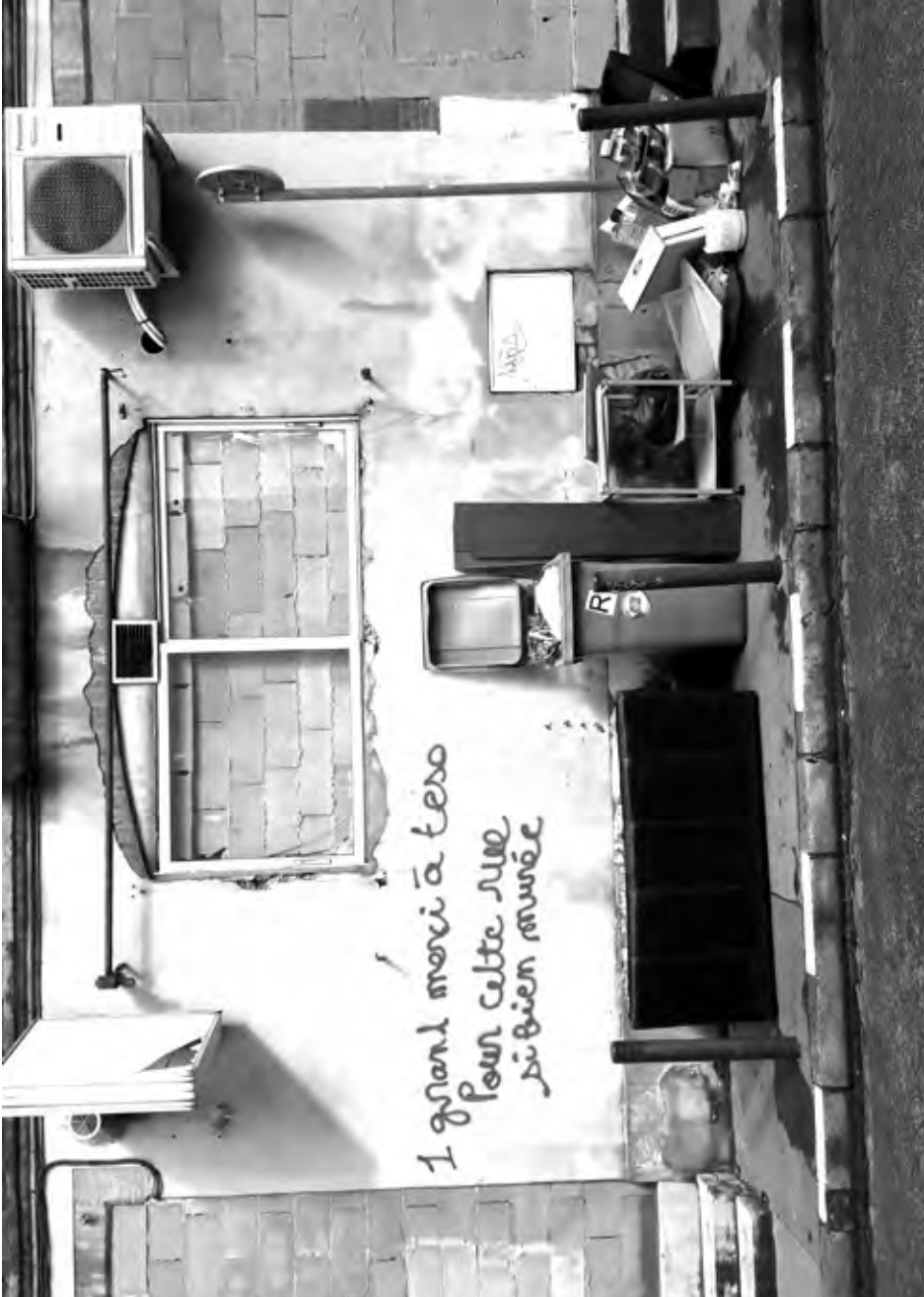
(III. 3.) Graffiti anti-TESO dans une des rues destinées à être rasées. (avril 2019).