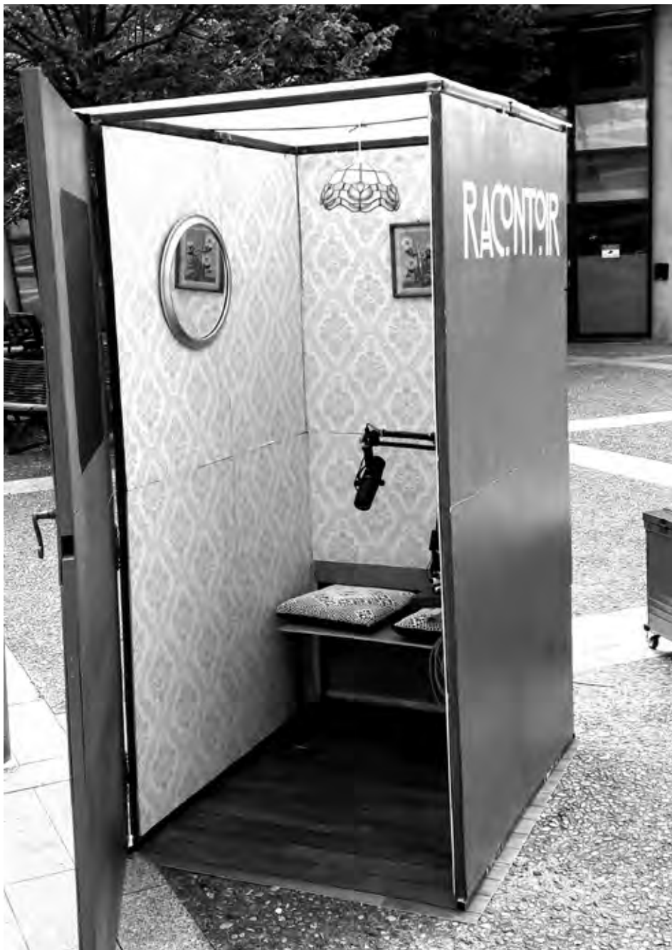
(III. 2) Le racontoir installé dans l'espace public en juillet 2018.