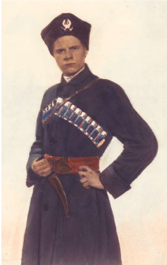
André Leroi-Gourhan déguisé en cosaque. Vers 1926-1927.

Il fréquente les séminaires de Paul Granet et de Marcel Mauss à l'École pratique des Hautes Études et fait partie, avec Marcel Griaule et Germaine Dieterlen, de la première génération d'étudiants à passer le certificat d'ethnologie. Il envisage de devenir bibliothécaire et s'inscrit à l'École municipale des bibliothécaires de la ville de Paris en 1930-1931 et 1931-1932.