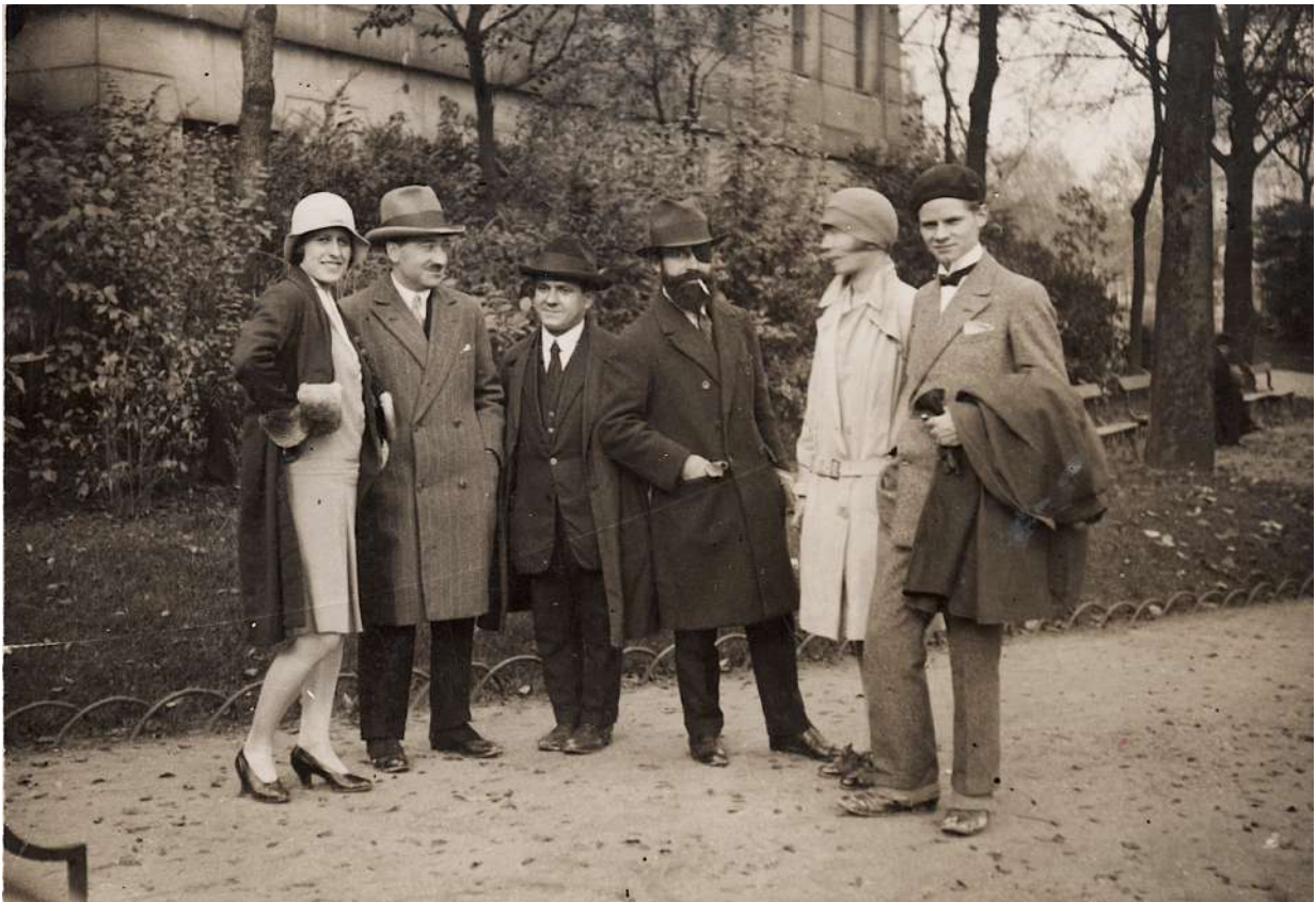
André Leroi-Gourhan (à droite) dans une rue de Paris. Les autres personnes n'ont pu être identifiées. 1926

Sa passion pour les objets et ses compétences muséographiques aboutissent à la publication de L'Homme et la Matière en 1943 et de Milieu et Techniques en 1945. Cette même année, il soutient sa thèse sur l'Archéologie du Pacifique Nord commencée sous la direction de Marcel Mauss et la publie l'année suivante. Nommé maître de conférences en Ethnologie coloniale à Lyon en 1944, il y développe entre autres un enseignement de technologie comparée à partir de l'étude de collections d'objets ethnographiques du Musée colonial de la Chambre de Commerce de Lyon 7 . Ne concevant pas l'ethnologie sans une part de terrain, il sillonne le Mâconnais avec des étudiants qu'il initie à ce qu'il appellera plus tard l'ethnologie préhistorique. De cette période datent ses premières fouilles à la grotte des Furtins (Saône-et-Loire) en 1946 puis dans les grottes d'Arcy-sur-Cure (Yonne) en 1947. Sous l'influence des archéologues russes des années 1930, il conçoit une méthode de fouille par décapages horizontaux qui permet de retrouver les vestiges à l'emplacement qu'ils occupaient au moment de leur abandon. Dans un manuel de fouille publié en 1950, il prône l'enregistrement systématique et exhaustif des vestiges de toutes catégories et insiste sur le fait que les vestiges en eux-mêmes comptent moins que leurs interrelations.