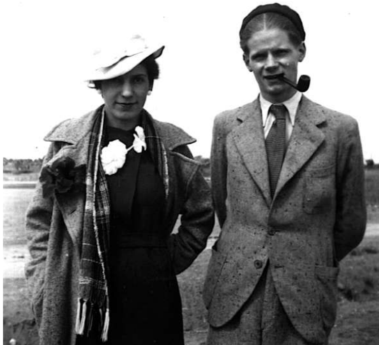
André Leroi-Gourhan et son épouse Arlette, lors d'une escale en route pour le Japon. 1937

Il est intéressant de suivre l'évolution des centres d'intérêt d'André Leroi-Gourhan ainsi que les étapes de sa professionnalisation dans l'annuaire des membres publiés au début de chaque