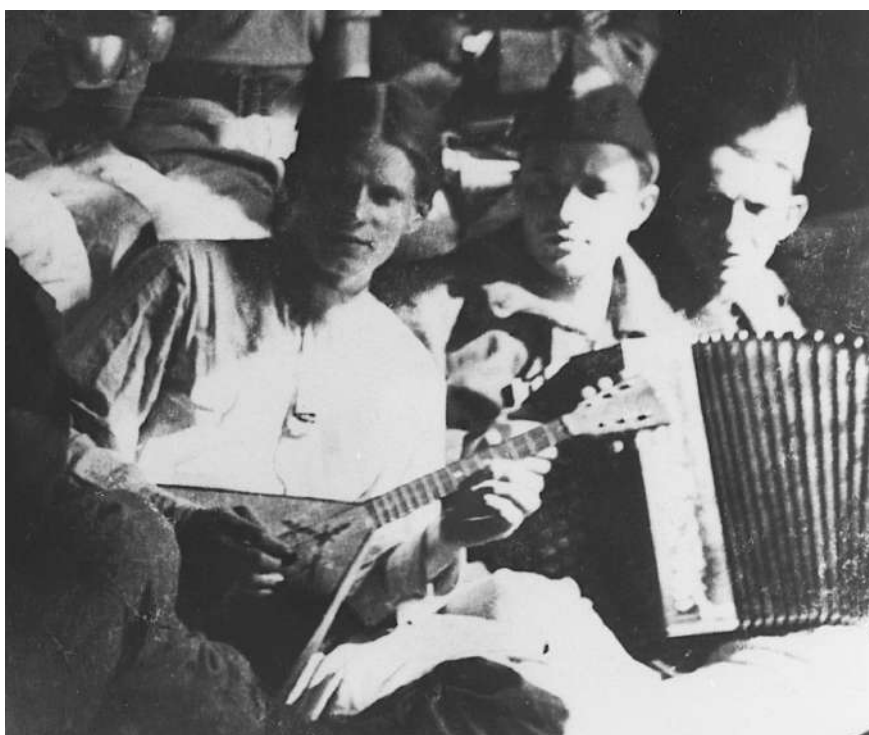
André Leroi-Gourhan jouant de la balalaïka avec ses amis russes. Vers 1926-1927