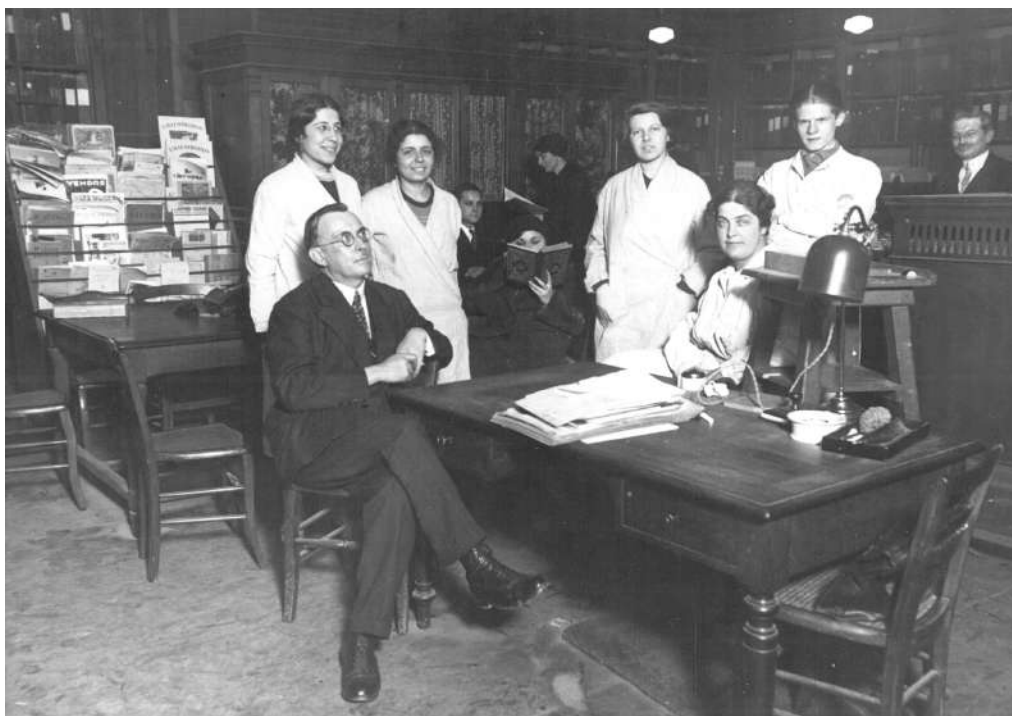
André Leroi-Gourhan suivant les cours de formation au métier de bibliothécaire de la ville de Paris. Ici, à la bibliothèque Forney. 1931-1932