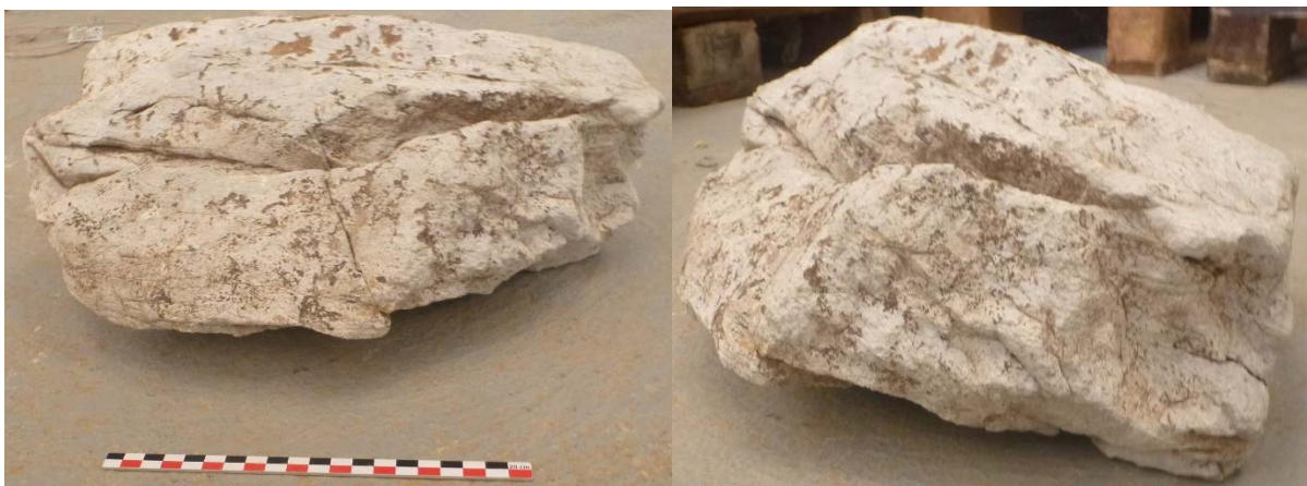
Figure 3 : Marques de frottement sur le second bloc