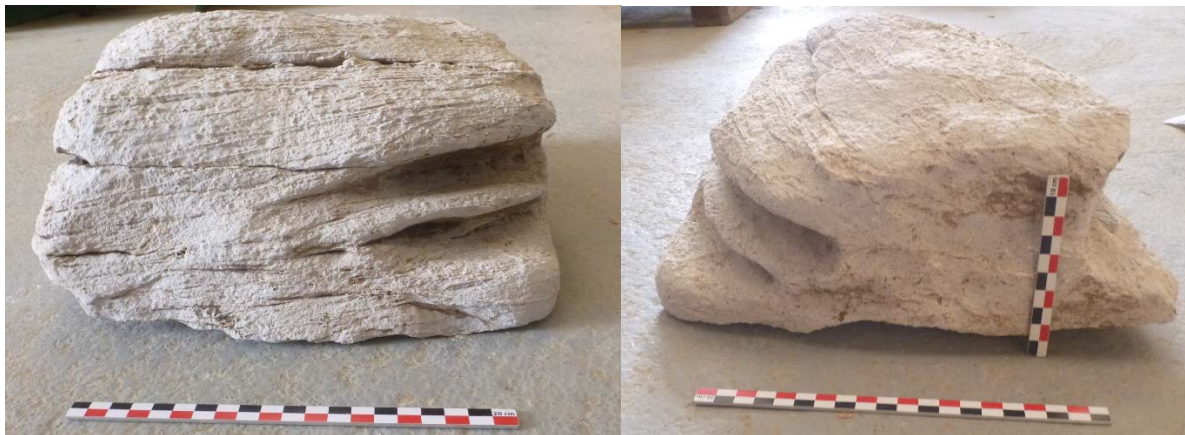
Figure 2 : Marques de frottement sur le premier bloc

Le premier bloc se présente sous la forme d'un rectangle et le second d'un pentagone. Ils possèdent tous deux des marques le long de leur flanc, probablement dues au frottement par un cordage. Ces marques sont assez profondes sur le premier bloc mais restent légères sur le second (figure 2 et 3).