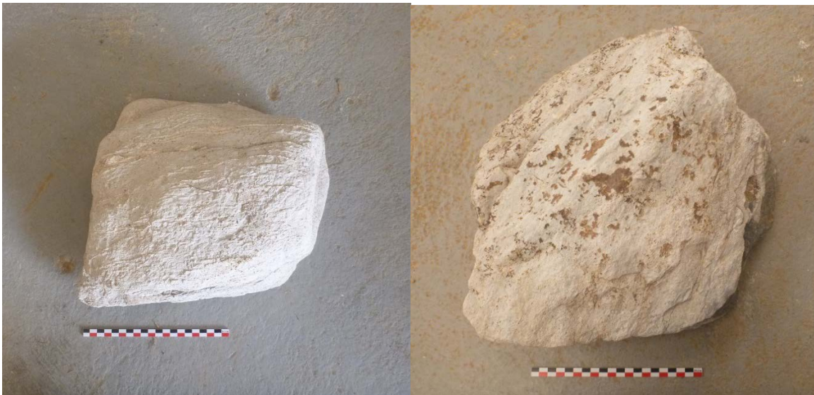
Figure 1 : Blocs de calcaire 1 et 6

Les blocs n° 1 et 6 de la sépulture 7 font intervenir un calcaire gris à grain fin, blanchi en surface et d'âge vraisemblablement paléozoïque (figure 1).