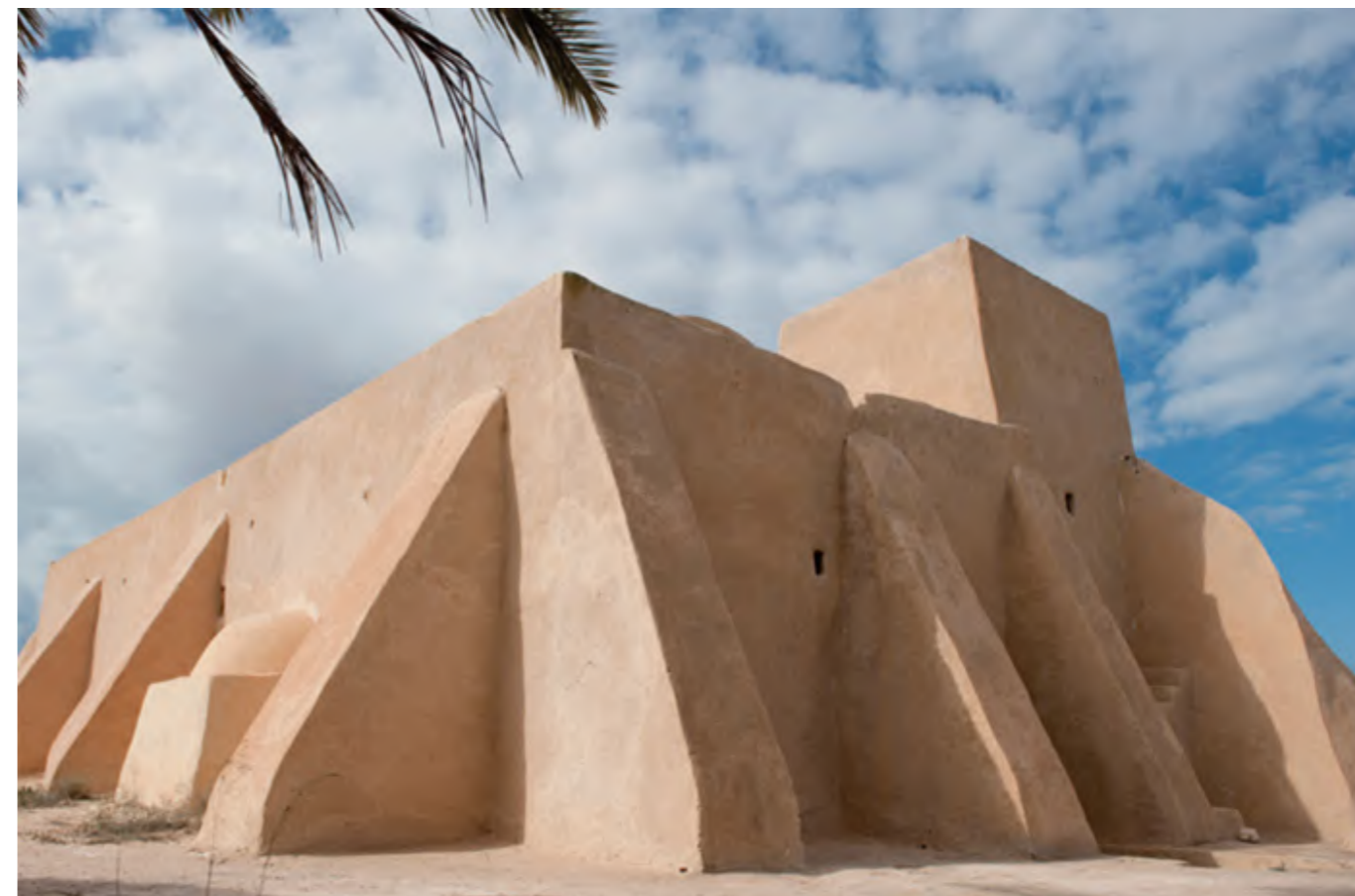
Une mosquée ibadite à Djerba (Tunisie).

Sa'īd . Entre les sessions, une boîte de dialogue, établie par le réseau social WhatsApp, permet de superviser et d'assister à distance les partenaires libyens. Des réseaux de solidarité communautaires transnationaux, dont on peut tracer les origines jusqu'au XV e siècle 18 , sont ainsi réactualisés et participent à la patrimonialisation des bibliothèques ibadites.