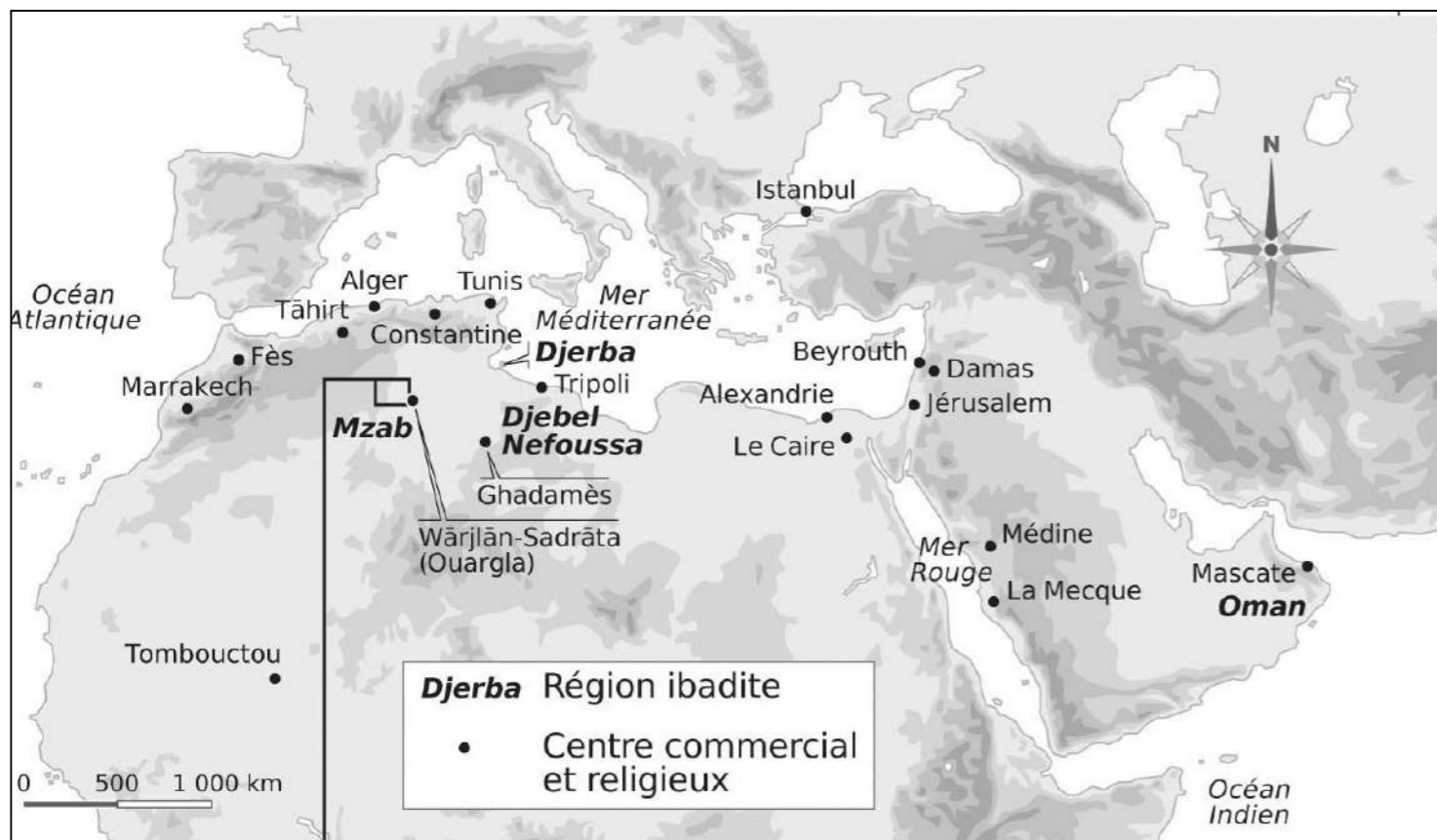
Carte de la région (2018). © Conception : Augustin Jomier ; Réalisation : Cyrille Suss