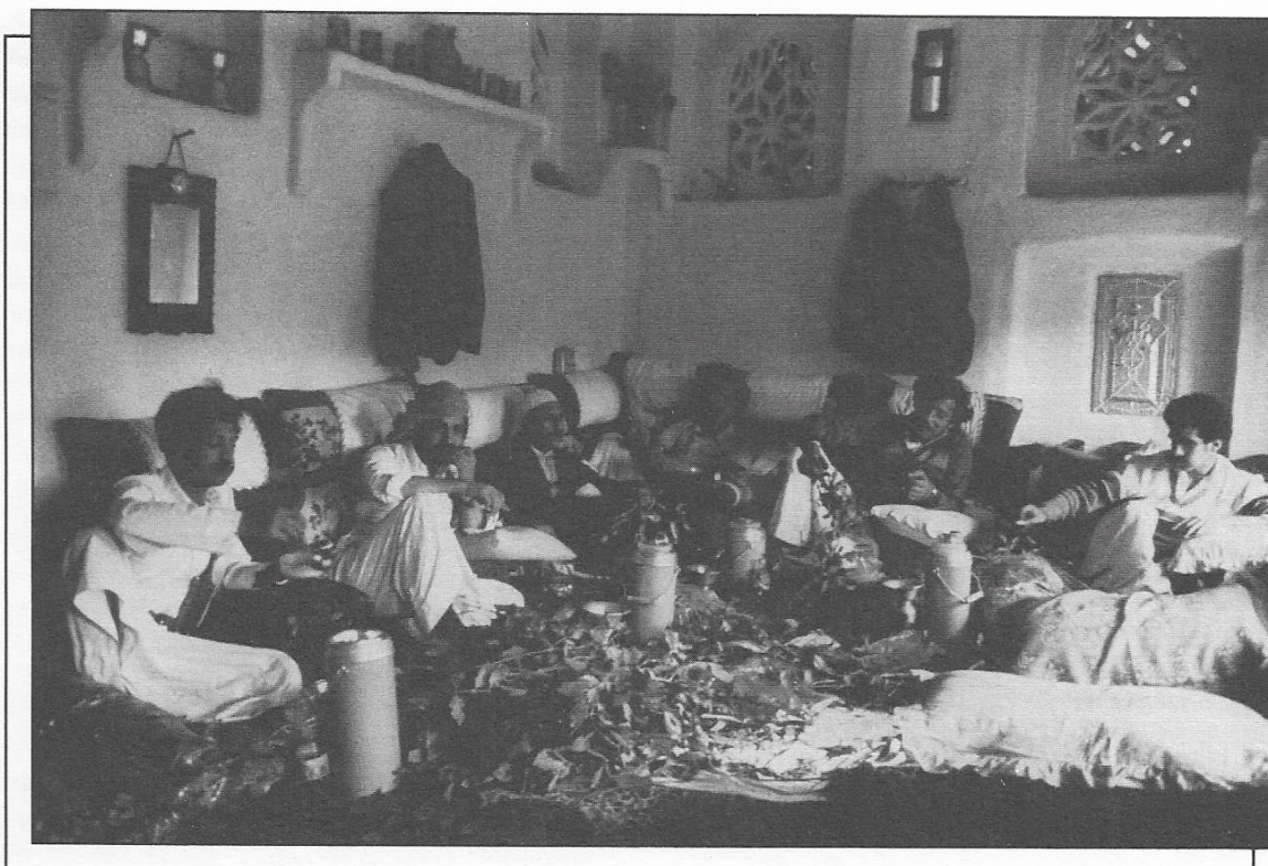
Figure 3 : Le magyal, consommation traditionnelle de qat au Yémen.