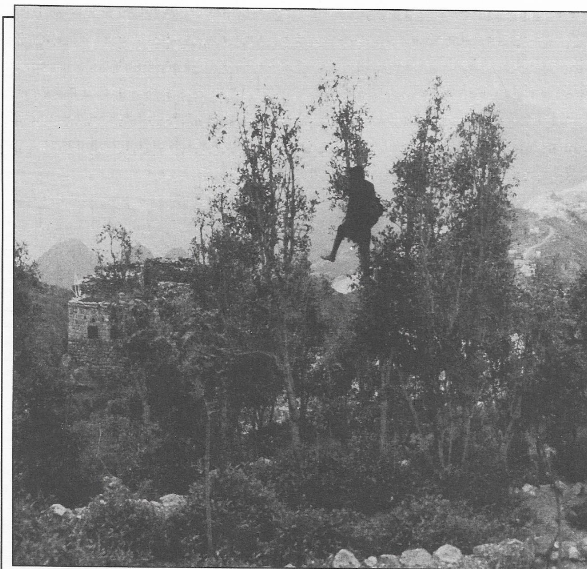
Figure 1 : Cueillette de qat au Yémen.