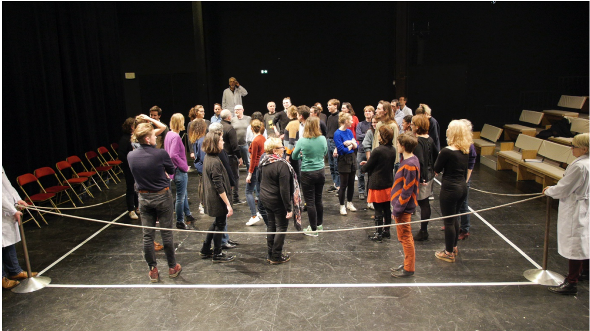
Figure 4 : Finir par faire Monde commun

sociétés, au centre de leurs préoccupations. Et aussi parce que le théâtre, depuis ses origines occidentales antiques, n'a cessé d'être politique (Neveux, 2013). C'est autour de l'enjeu politique que l'on peut articuler l'anthropocène, les sciences sociales et le théâtre. Le théâtre fournit donc un dispositif opératoire pour écrire, collectivement, ce nouveau récit. Et la scène de ce drame devient alors le Monde (cf. Figure 4).