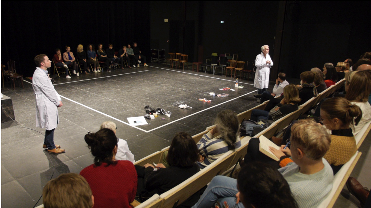
Figure 3 : Un laboratoire sur un plateau