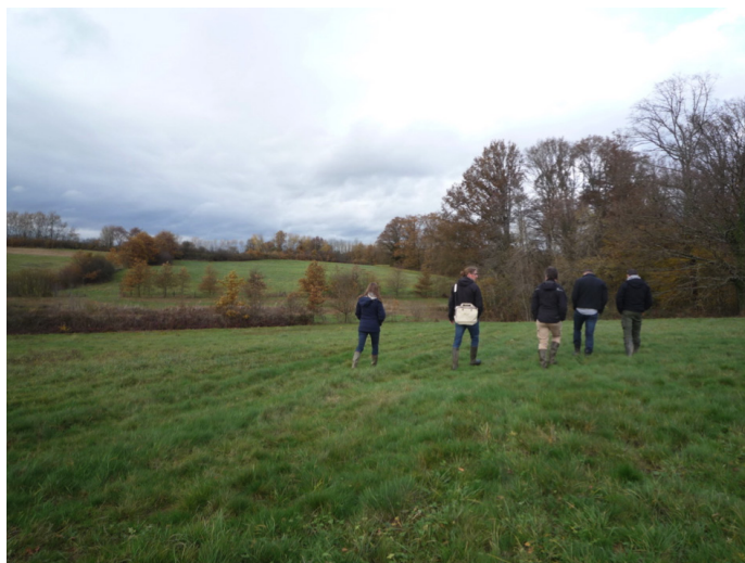
Visite d'un agriculteur portant une mesure de pâturage extensif, Bourgogne, novembre 2019.

Si les autres régions ne présentent pas d'initiative régionale officielle, des réflexions collectives sont néanmoins en cours et semblent précéder la mise en œuvre de l'engagement du secteur agricole qui reste