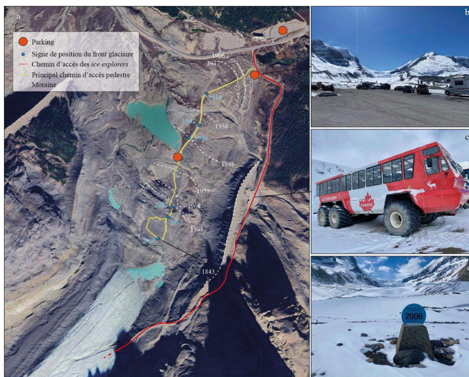
Figure 3. a. Situation du front du glacier Athabasca, des itinéraires touristiques et des extensions passées du glacier. Photographie aérienne : Airbus via GoogleEarth (juillet 2022). Les représentations des moraines sont basées sur les travaux de Luckman (1988) b. Vue du parking (Salim, avril 2024). c. Aire de stationnement des ice explorers (Salim, avril 2024). d. Signe de la position du glacier en 2006 (Salim, avril 2024).

Les photographies ont été prises avant le début de la saison touristique et ne reflètent pas la fréquentation possible dans la haute saison touristique.