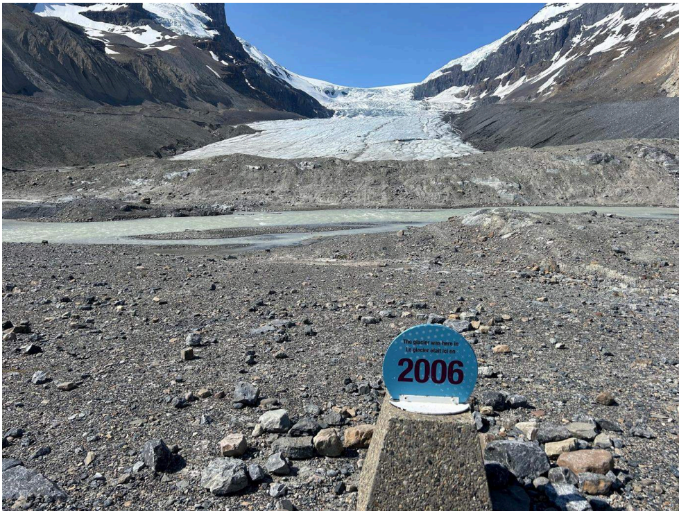
Figure 1. Signe montrant la position du front du glacier Athabasca en 2006