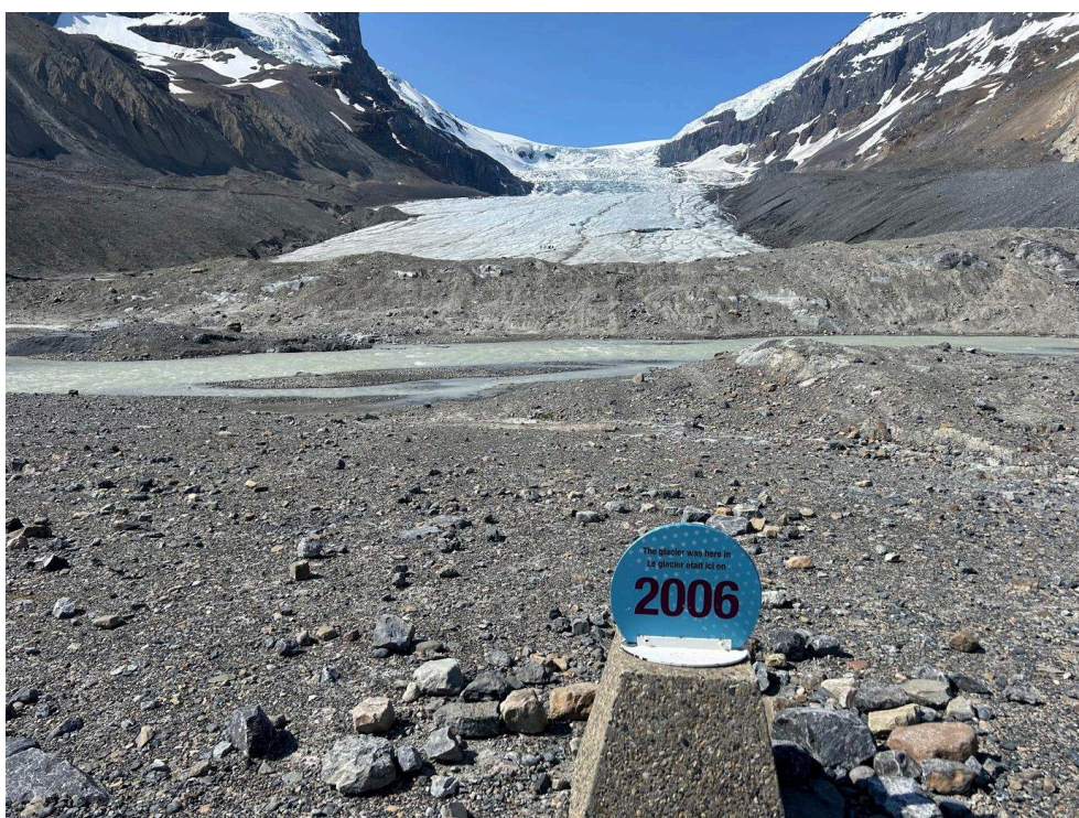
Figure 1. Signe montrant la position du front du glacier Athabasca en 2006