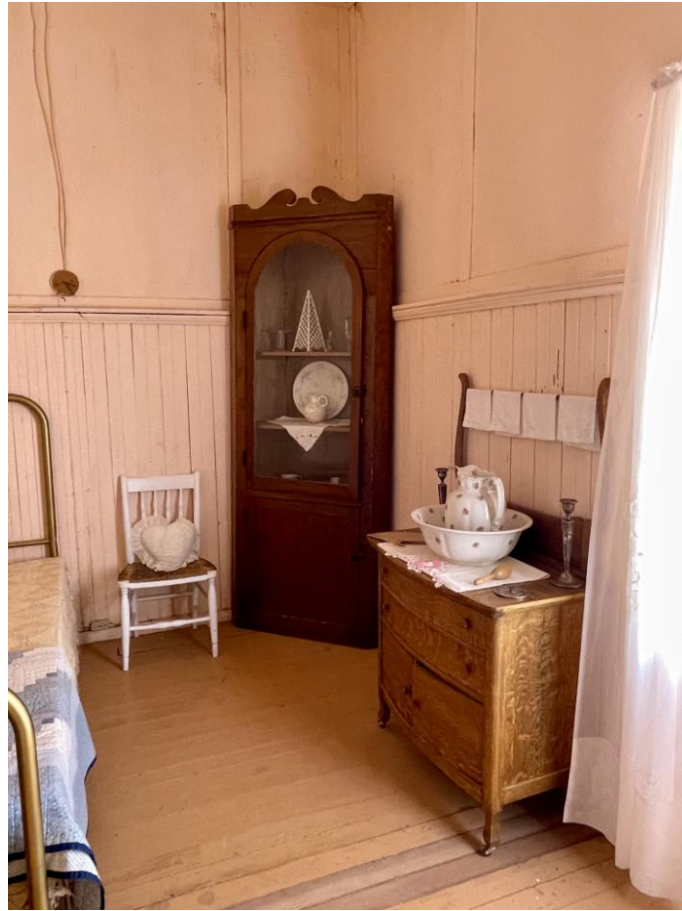
Figure 4 – Chambre de la nurse