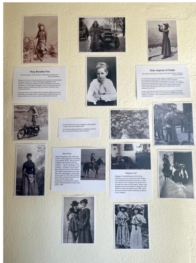
Figure 5 – Le mur des oubliées

employées par les vaqueros mexicains depuis le XIX e siècle, mais le conseil d'administration d' ERF , lui, s'y est opposé. Ces choix dans la muséologie – ou plutôt ce jeu de suggestions, négociations, impositions – rappellent que la valorisation du patrimoine est aussi un travail d'édition traversés de luttes (Tornatore 2004), y compris locales, autour du choix des identités à célébrer et des vérités à énoncer.