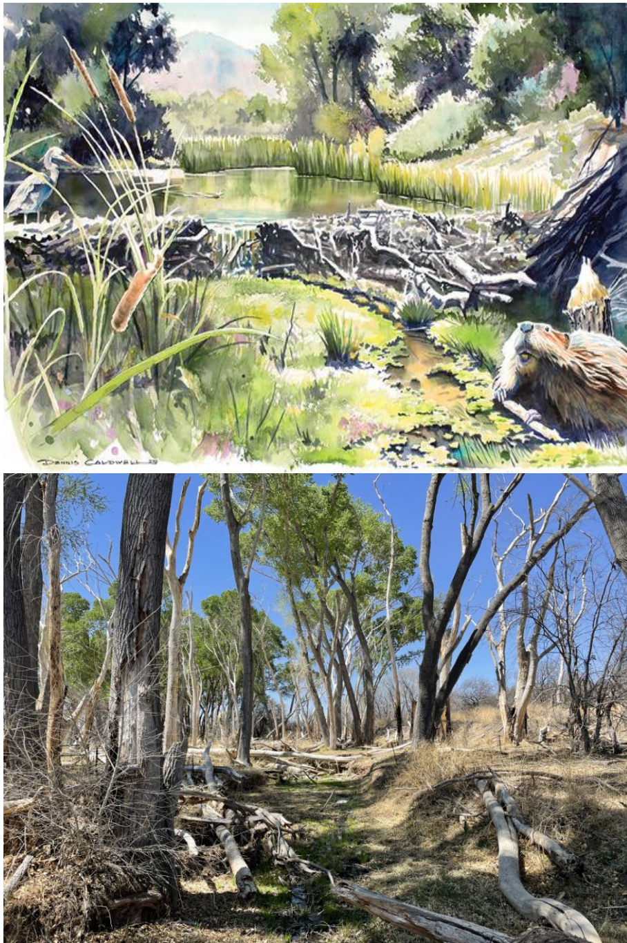
Figure 3. Comparaison entre une aquarelle illustrative du futur rêvé de la Cienega Watershed 1 et son état actuel