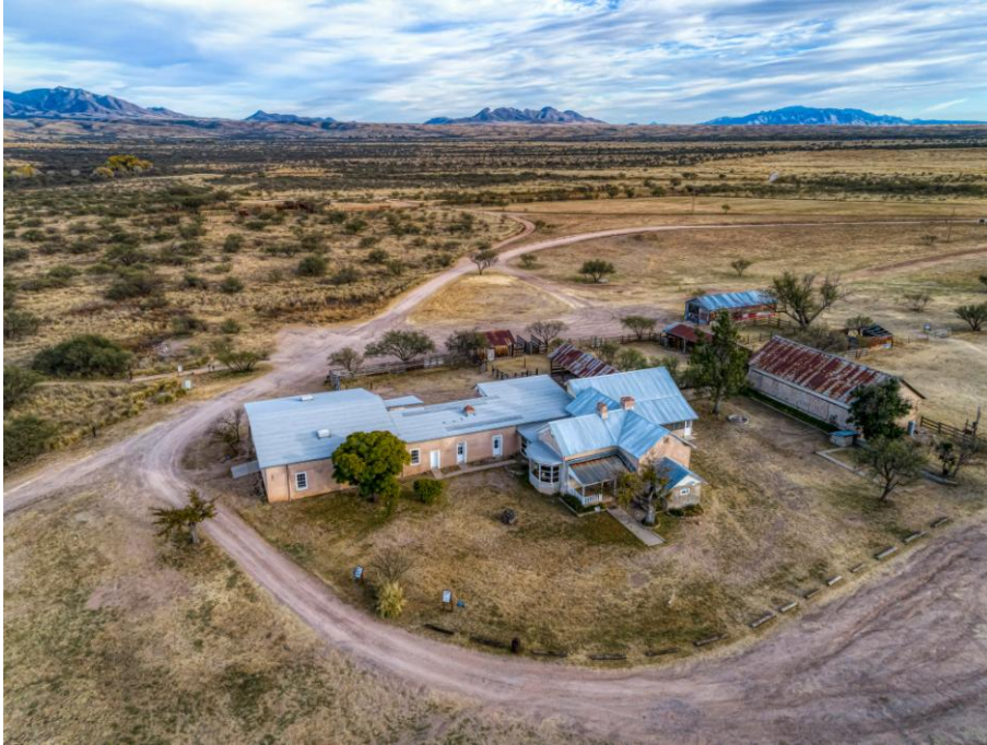
Figure 2 - Les bâtiments d'Empire ranch aujourd'hui

ranch par une série d'échanges de terres. Pour la première fois depuis 1871, les terres – et la maison – repassent sous gestion publique.