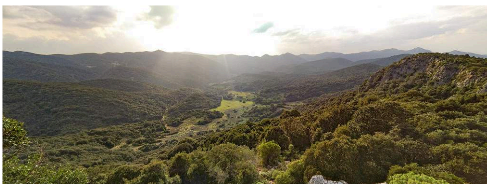
Fig. 1. Vue de la vallée d'Antas depuis le plateau de Canali Bingias.