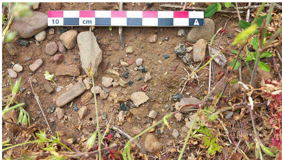
Fig. 3. Vue représentative des scories identifiées en surface.