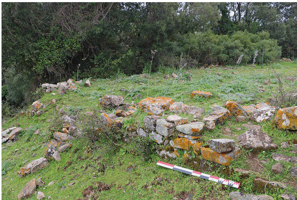
Fig. 4. Vue de l'arase d'un mur autour duquel se trouve une concentration de plomb.

supposer ici une occupation liée au travail des minerais ou des métaux ( fig. 4 ). Dans la mesure où des rejets l'entourent, ce travail pourrait s'organiser dans le bâtiment.