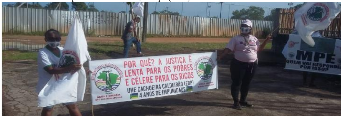
Figura 1 – Manifestação de pescadoras, pescadores, agricultoras e agricultores atingidos pela UHE Cachoeira Caldeirão em frente ao Fórum do Município de Porto Grande, Amapá (2021)