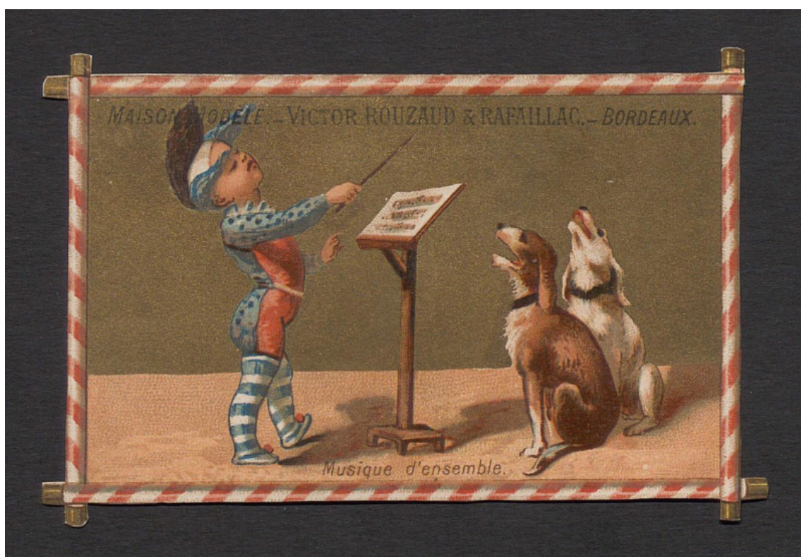
Figure 2. Le rôle de l'éditrice ou de l'éditeur

Musique d'ensemble , Testu & Massin (Paris) [18], EST 5 C/43, Estampe https://selene.bordeaux.fr/ark:/27705/330636101_EST_5_C_43/v0001.simple.highlight=musique%