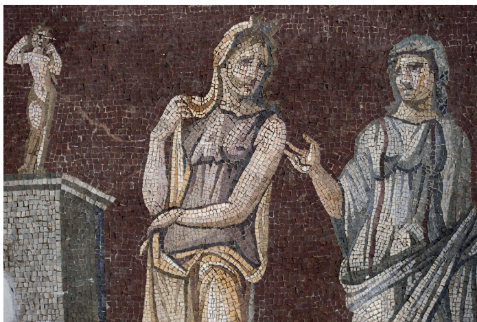
FIGURE 3b. Mosaïque des Saisons, Daphné, maison du Pavement rouge, détail des figures de Phèdre et de la nourrice.