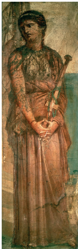
FIGURE 2. Médée méditant le meurtre de ses enfants (2 de moitié du 1 er siècle ap. J.-C.). Naples, MANN, 8976, tableau peint à fresque conservé de manière fragmentaire (il manque la moitié gauche de la composition) et provenant de la « Basilique » ( Augusteum ) d'Herculanum.

de la « Basilique » d'Herculanum, qui était en réalité un lieu du culte impérial ( Augusteum ) (fig. 2), et enfin le panneau avec Phèdre de la mosaïque des Saisons d'Antioche, datée de l'époque antonine (fig. 3a-b). A priori , on aurait plutôt tendance à interpréter ces trois images comme des témoins certains de l'influence du théâtre sur les arts figurés. La mosaïque des Synaristôsai fait référence à la représentation de la comédie homonyme