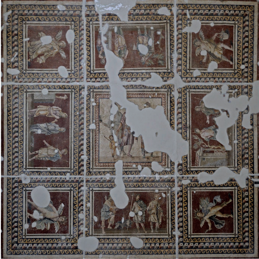
FIGURE 3a. Mosaïque des Saisons, Daphné, maison du Pavement rouge, milieu du II e s. ap. J.-C. Antakya, Museum Hatay, 1018.

Dans chaque angle figure un Génie représentant une Saison. Les scènes figurées sur les côtés et au centre ont été associées par K. Weitzmann à des sujets tirés de tragédies d'Euripide :