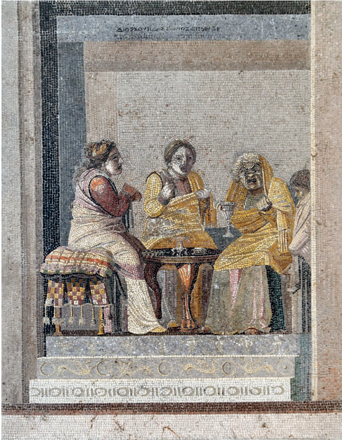
FIGURE 1. Scène tirée des Synaristôsai de Ménandre. Mosaïque en opus uermiculatum portant la signature de Dioscoride de Samos et provenant de la Villa dite « de Cicéron » à Pompéi, datée vers 100 av. J.-C. (Naples, MANN, 9987).

Nous considérerons ici, parmi tant d'autres exemples possibles, trois cas où les arts figurés ont pu exercer une influence sur les arts de la scène : la mosaïque des Synaristôsai de la villa dite « de Cicéron » à l'ouest de Pompéi, datée autour de 100 av. J.-C. (fig. 1), la peinture fragmentaire de la Medea medians (2 de moitié du 1 er s. ap. J.-C.) provenant