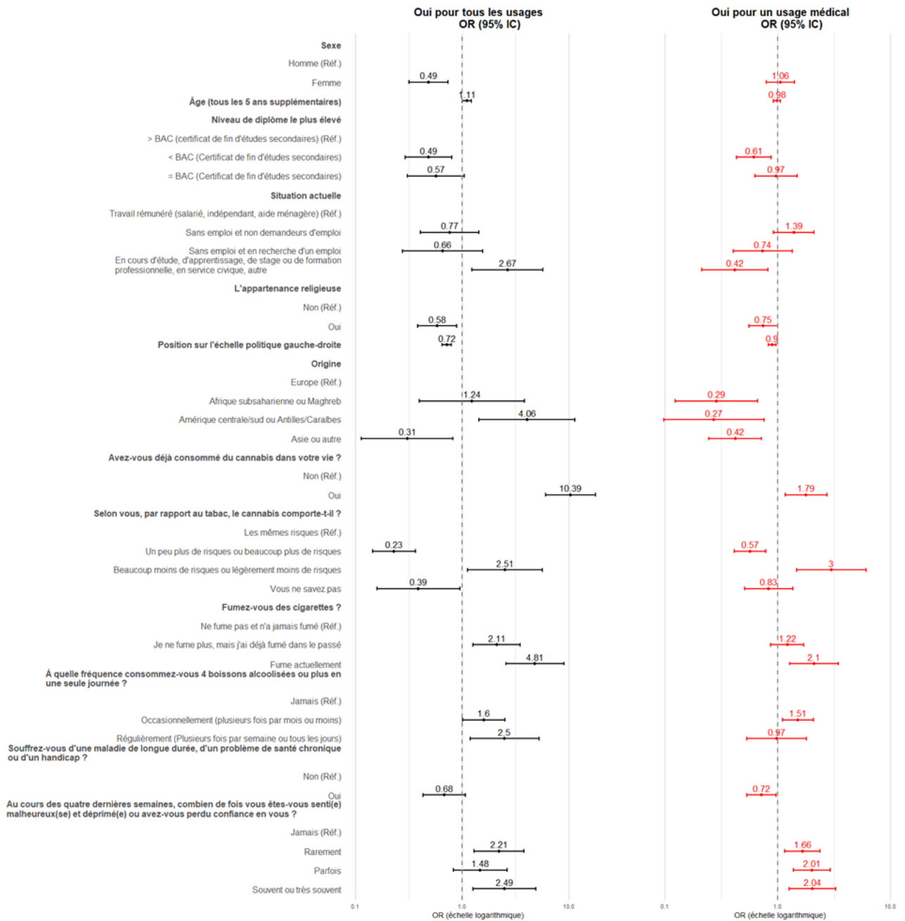
Figure 3. Facteurs associés aux opinions favorables à la légalisation du cannabis