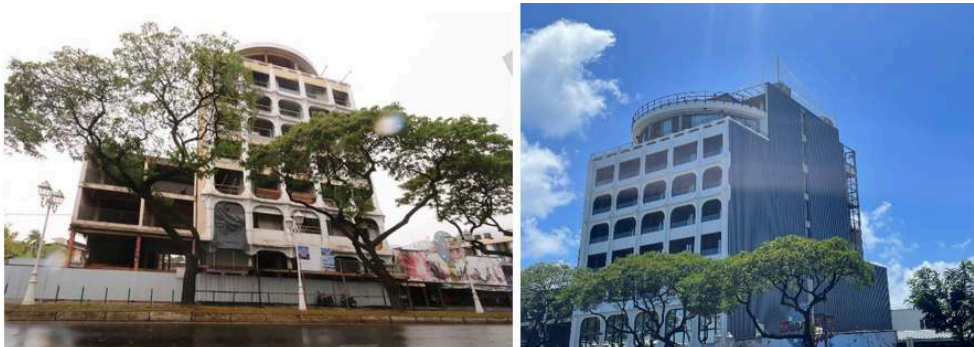
Illustration 1. L'Hôtel Kon Tiki avant et après sa rénovation écologique (gauche : début des travaux en 2019 ; droite : ouverture de l'hôtel en oct. 2022)

Crédits : photo gauche : Présidence PF ; droite : Island Studio Architecture