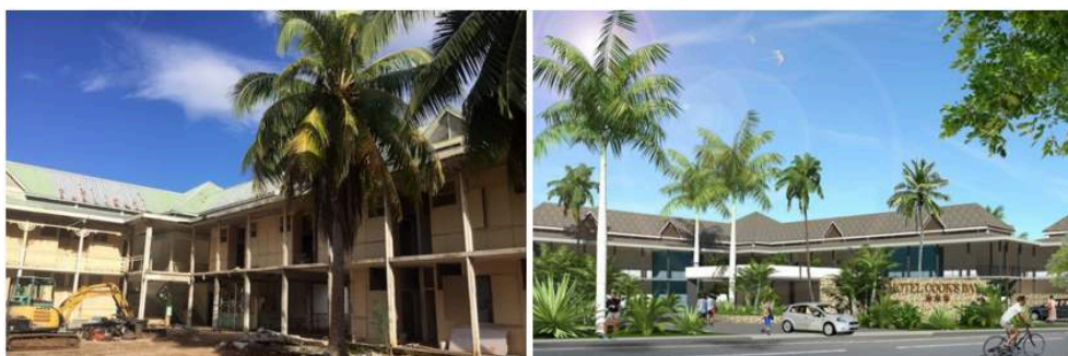
Illustration 5. La rénovation de l'ancien Hôtel Ibis à Moorea

Photographie de gauche : le début du chantier, photographie de droite : l'entrée de l'hôtel par image de synthèse après 14 mois de travaux. Le chantier de rénovation de l'ancien Hôtel Ibis à Moorea par l'architecte Alain Pauchard s'étend sur 2 800 m 2 , avec 76 chambres réparties dans trois bâtiments, une piscine en bord de plage, et un motu artificiel avec un restaurant relié à la plage par deux pontons sur pilotis. Le coût des travaux est estimé à 500 millions de Fcfp (4,2 millions €), plus 90 millions Xpf (750 000 €) pour le motu.