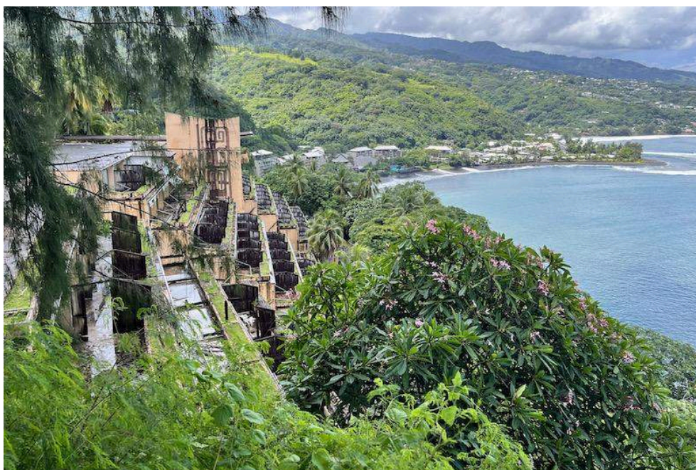
Illustration 2. Un exemple de friche touristique, le Tahara'a

De nombreux hôtels prestigieux sont laissés à l'abandon en Polynésie française, tels que l'InterContinental ou le Club Med de Moorea, le Tahara'a, le la Ora Beach Resort à Tahiti, le Hyatt à Bora Bora ou encore le Sofitel de Huahine