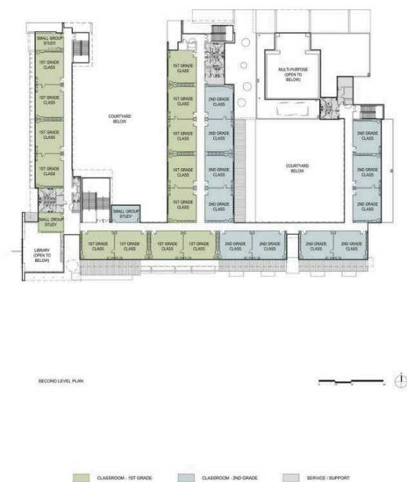
CENTRAL LOS ANGELES LEARNING CENTER NO. 1 HERITAGE K-3 / DOUBLE COURT OPTION 29 JULY 2009