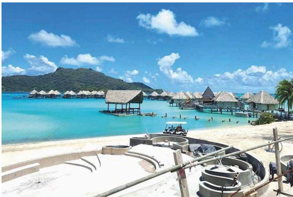
Illustration 3. Le Sofitel de Bora Bora, abandonné depuis 2023