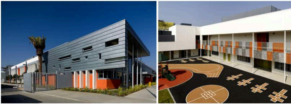
Illustration 4. La reconversion de l'ancien hôtel Ambassador de Los Angeles