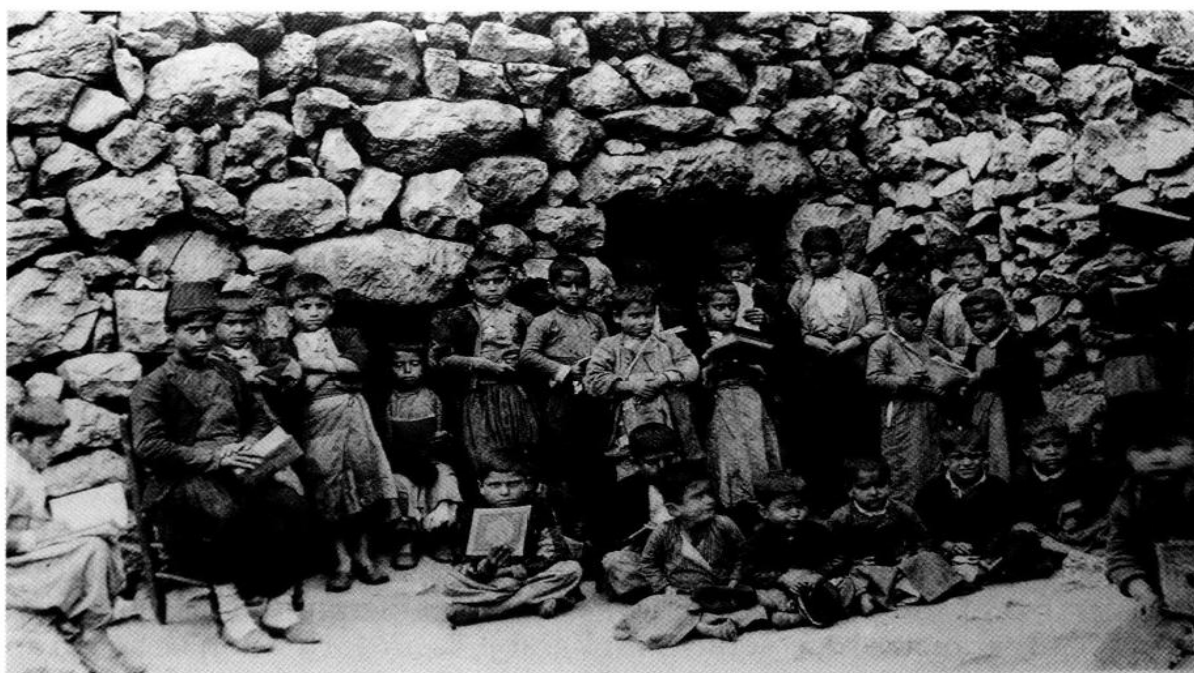
Photographie N° 2.

suffisant, l'Institut s'éteint peu à peu au milieu des années 1870 93 . Quelques années plus tard, le P. Barnier ouvre à Dayr al-Sayda ce qui doit devenir une école normale, où l'on enseigne l'arabe, la lecture, des éléments de grammaire et de syntaxe, la géographie, l'arithmétique, l'histoire sainte et l'histoire ecclésiastique 94 , mais il éprouve bien des difficultés à la faire vivre et elle n'a pas survécu à son départ de Homs.