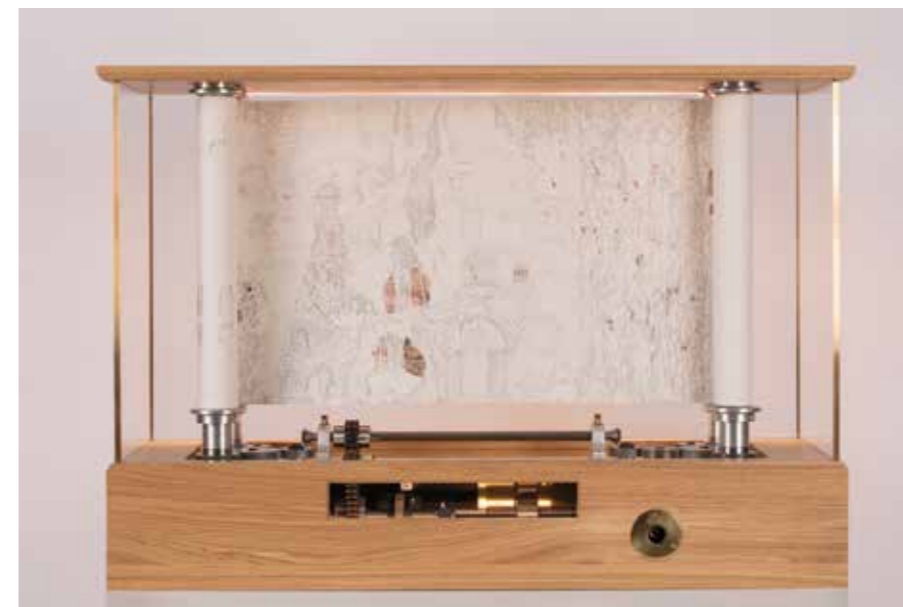
Eva Jospin, Carmontelle 4 , 2024, encre sur papier, calque, bois, plexiglass, mécanisme, 40,3 x 117 x 82,3 cm

planches. Une recherche relativement proche était menée durant ces mêmes années par Carmontelle dans ses "transparents", ces longs rouleaux de feuilles peintes collées bout à bout qui, tendus entre deux bobines et éclairés par transparence, défilaient en donnant au spectateur l'impression de se mouvoir à travers un paysage et même plus précisément d'un jardin "anglo-chinois" tel que celui conçu à Monceau par ce peintre et auteur dramatique pour le duc de Chartres 5 . On ne peut en tout cas qu'être frappé par la dimension cinématique de l'œuvre d'Eva Jospin : non seulement elle est impossible à appréhender d'un seul coup d'œil et requiert de se déplacer de gauche à droite, mais elle incite aussi, constamment, à un mouvement de va-et-vient pour tantôt se rapprocher afin d'apprécier les détails, tantôt s'éloigner pour appréhender l'effet d'ensemble.