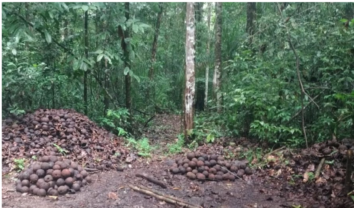
Figura 2 | Ramal de acesso ao castanhal do Chicota, comunidade Santarém, Reserva Cajari (29 de março de 2024).