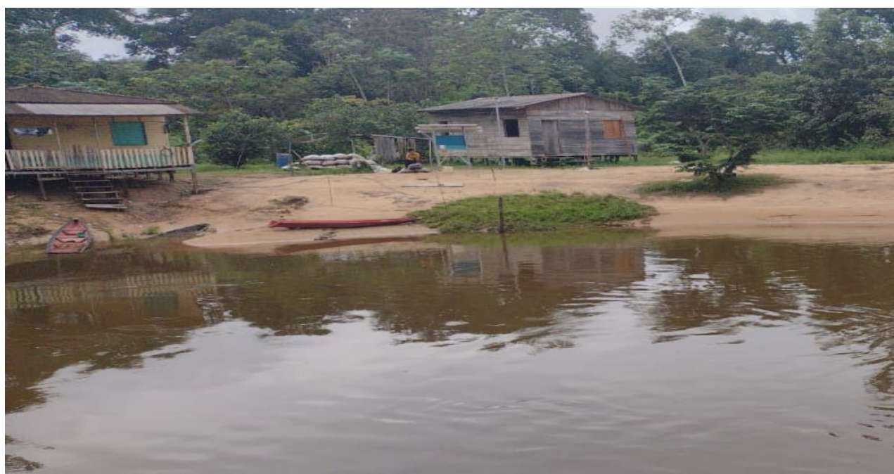
Figura 3 | Rio que passa pela Comunidade de Santarém, Reserva Cajari, (29 de março de 2024).