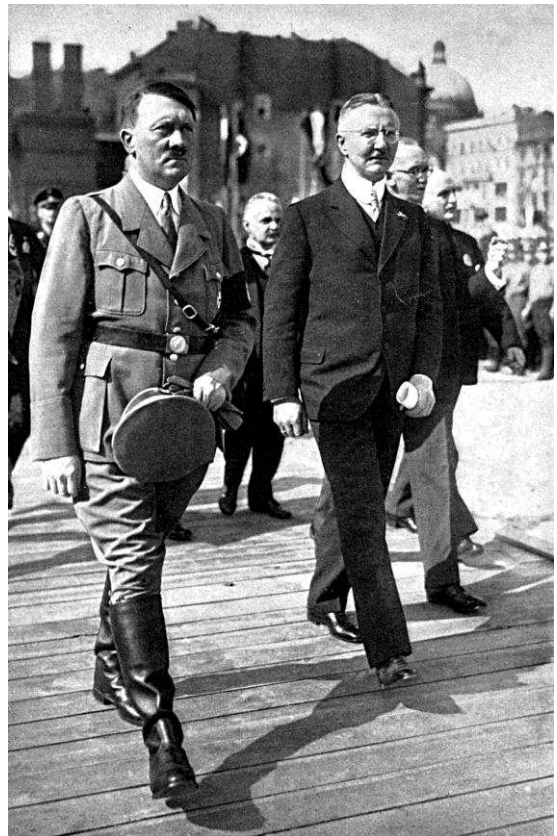
Figure 3 – Hitler et Schacht pour l'inauguration des travaux du nouveau bâti- ment de la Reichsbank 433