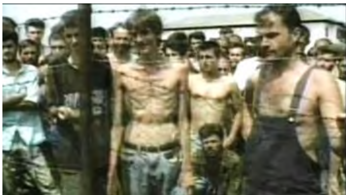
Image prise le 6 août 1992 dans un camp d'internement à Omarska (près de Prijedor, nord de la Bosnie-Herzégovine) tenu par les autorités serbes locales et l'armée de la République serbe. Image prise par des journalistes britanniques (Ed Vulliamy, The Guardian , Ian Williams et Penny Marshall de la chaîne de télévision ITN accompagnés du caméraman Jeremy Irvin). Le reportage a été diffusé le soir-même sur la chaîne Channel Four Channel et ITN. Cette image a fait le tour du monde.